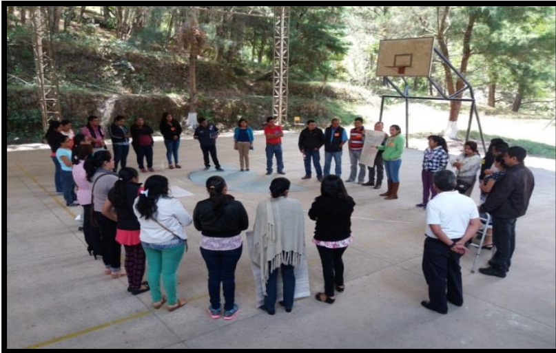
Anexo 13 Sesión I Talleres de Capacitación Presencial A docentes en servicio Olopa, Chiquimula 2017

Representantes de La MESA TÉCNICA (IIARS, PNUD/PAJUST EDUVIDA y ESCUELA DE HISTORIA)