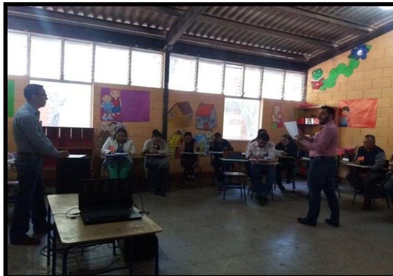
Anexo 14 Sesión I Nuevo enfoque De la Formación Ciudadana Evaluación Inicial Ministerio de Educación.