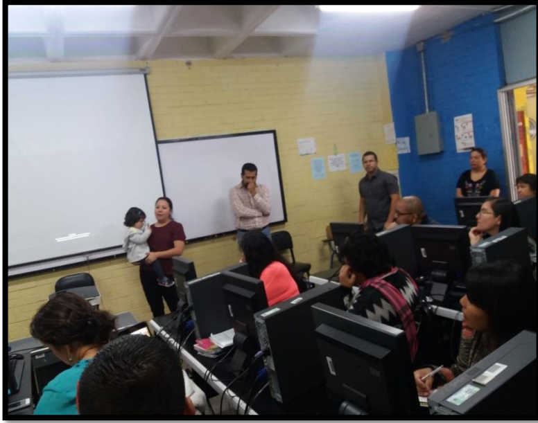
Anexo 12 Taller presencial con Docentes De los Deptos participantes

Representantes de La MESA TÉCNICA (IIARS, PNUD/PAJUST EDUVIDA y ESCUELA DE HISTORIA)