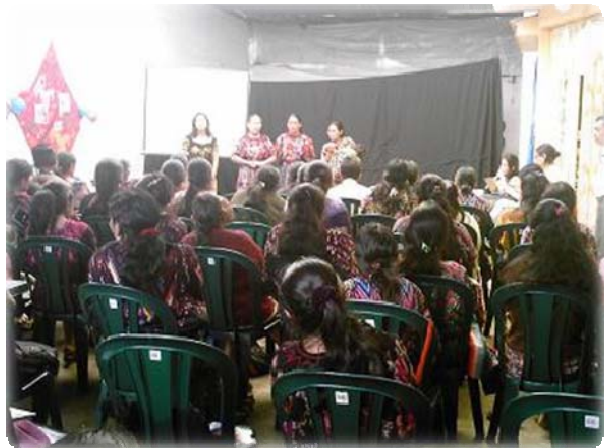
Fotografías 11 y 12 Evaluación verbal sobre la fase de ejecución del curso taller