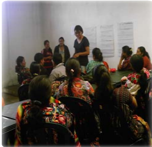
Fotografía 5 Reunión en la que la estudiante de EPS orientó al grupo para identificar sus necesidades e intereses