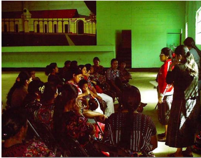
Fotografía 10 Evaluación verbal, de la fase de planificación del curso taller