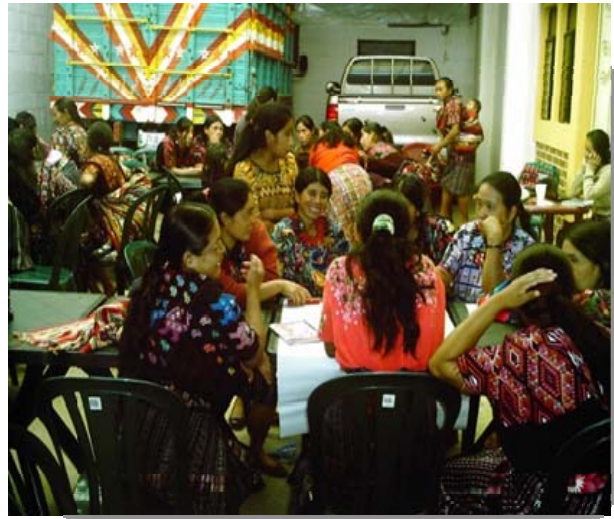
Fotografías 6 y 7 Técnica para dividir en grupos de trabajo, para elaborar la priorización de necesidades