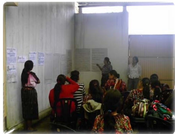
Fotografías 8 y 9 Socialización de las mujeres, referente a los elementos que contienen los perfiles de proyectos