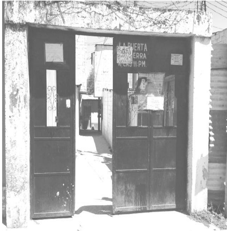
Esta es la única entrada al asentamiento Alfa Nueva Generación.