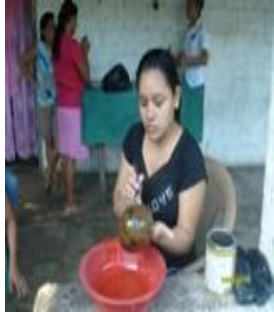
Capacitación de bisutería, decoración de morros y piñatería