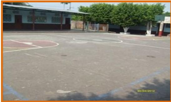
Cancha de básquet bol