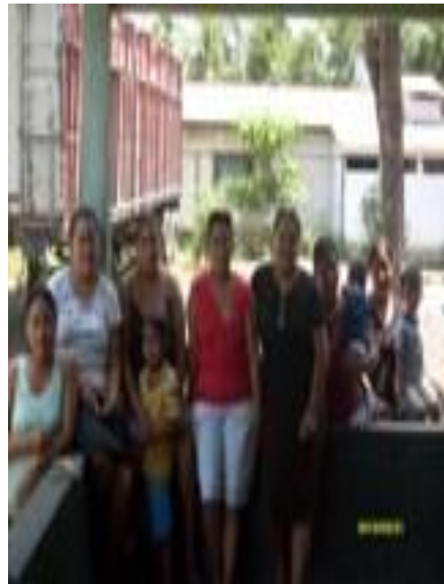
Capacitaciones en repostería, belleza, corte y confección.