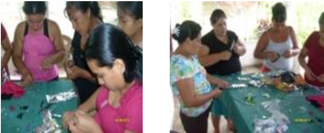
Grupo de mujeres que participaron en la fase de capacitación