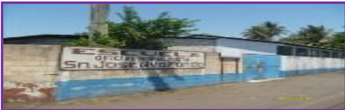
Escuela del parcelamiento San José Nuevo Mundo