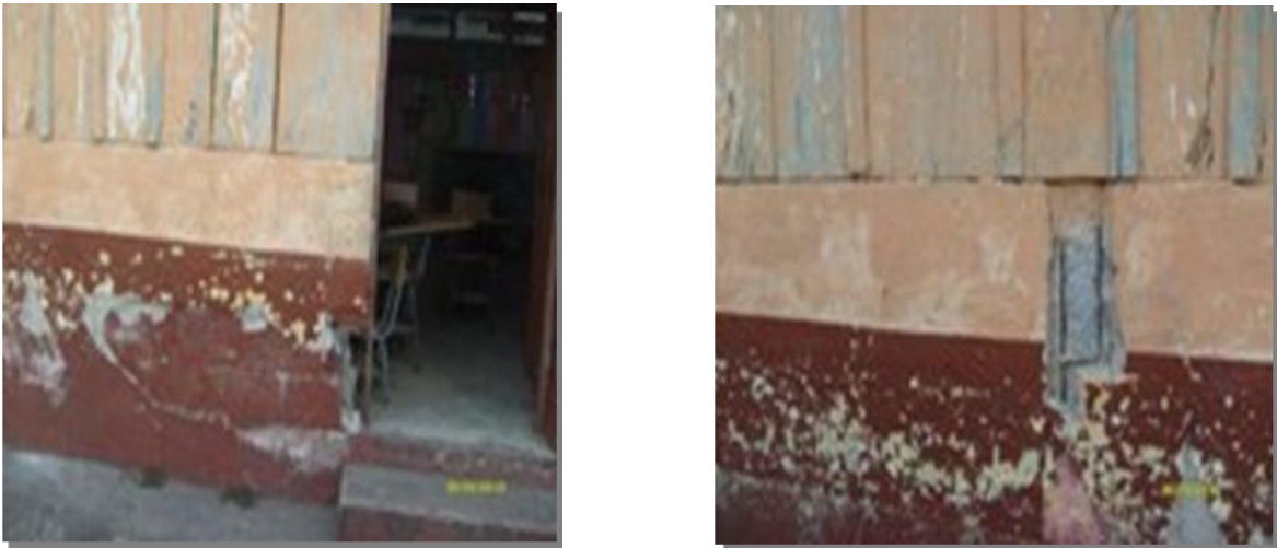
Aulas en mal estado

Se considera necesaria la remoción de la cancha de basquetbol, esta tiene pequeñas rajaduras que han hecho que el cemento de la misma se levante, lo que ha provocado accidentes a los estudiantes lo que representa un peligro al correr, y solamente se cuenta con esta área para que los niños y niñas jueguen durante el receso.