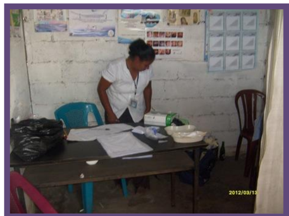
Parte exterior e interior de la bodega de iglesia católica