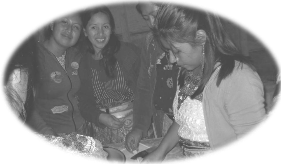
Grupo "Lideresas Paquipenses"