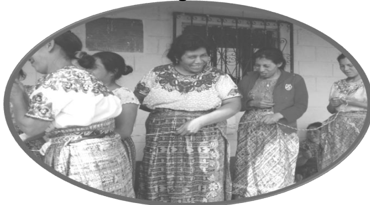
Grupo de mujeres de cantón Xiprian, técnica de comunicación.