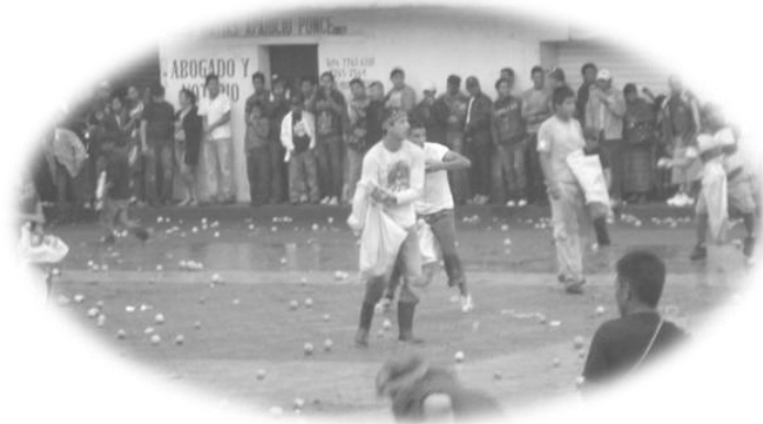
La Toronjeada, tradición celebrada el Viernes Santo