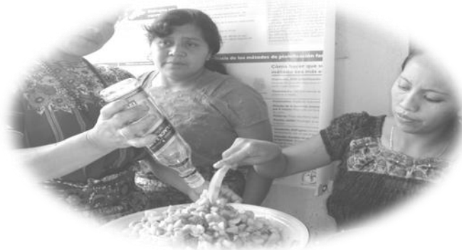
Grupo de mujeres de cantón Xiprian, preparando ensalada de frutas.