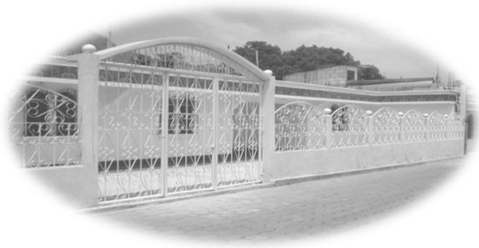
Vivienda en el centro de la aldea Paquip.

Durante la aplicación de la técnica de observación se pudo apreciar los diferentes materiales utilizados en la construcción de las viviendas. En el cuadro 6 se detalla una serie de materiales utilizados en la fabricación de las mismas: