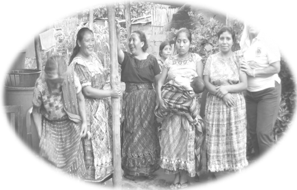
Grupo de mujeres del caserío Xemonte.