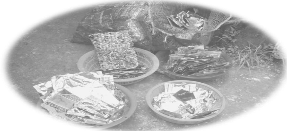
Materia prima utilizada.