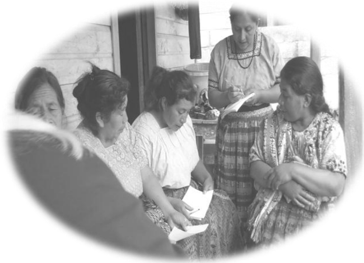
Integrantes del grupo Unidas por la Paz