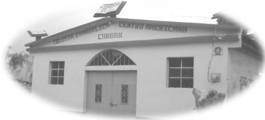
Iglesia Evangélica Centro Americana Canaán, aldea Paquip, Santa Clara La Laguna.

En la aldea Paquip hay una iglesia católica la cual se encuentra en el paraje Triunfo La Paz, la población también tiene la opción de asistir a la iglesia católica en la cabecera municipal, además se observó la existencia de otras iglesias evangélicas en el camino hacia el centro de la aldea Paquip.