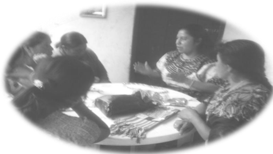
Grupo de mujeres “Los Manantiales”