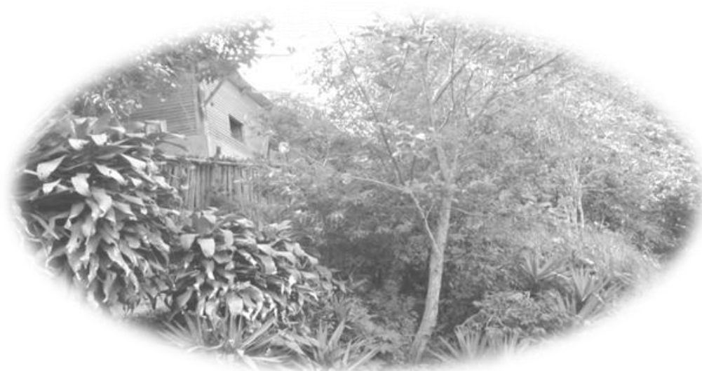
Vivienda en el paraje Triunfo La Paz, aldea Paquip, ubicada en una ladera del camino.