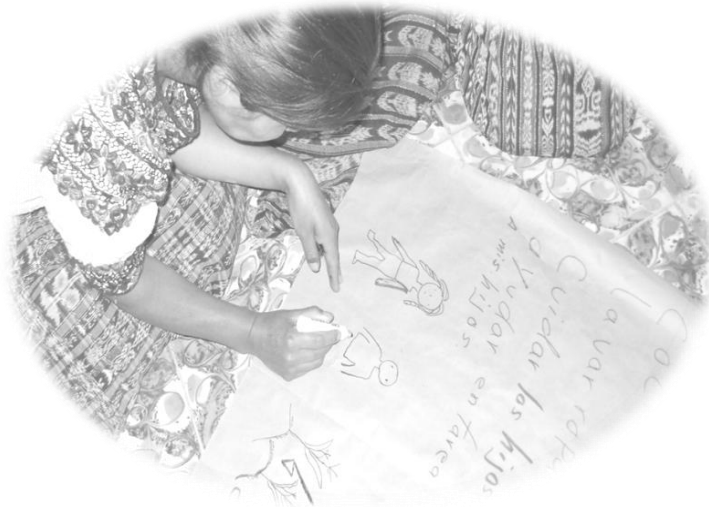
Grupo Lideresas Paquipenses durante taller sobre equidad de género.