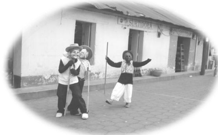
Baile de negritos Xoroquecos, Santa Clara La Laguna, realizado durante las celebraciones de cuaresma y otras fechas importantes en el año.