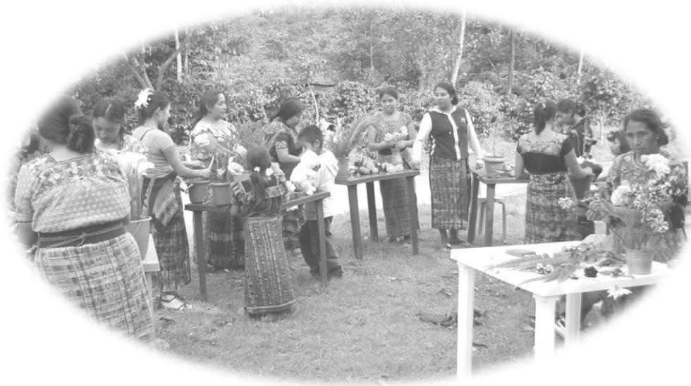
Grupo de mujeres "Flor del Café"