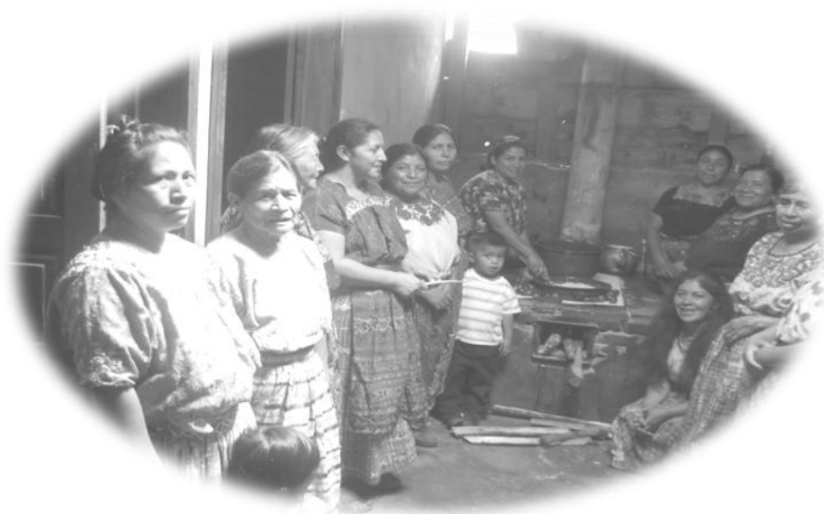
Grupo de mujeres "Unidas por la Paz".