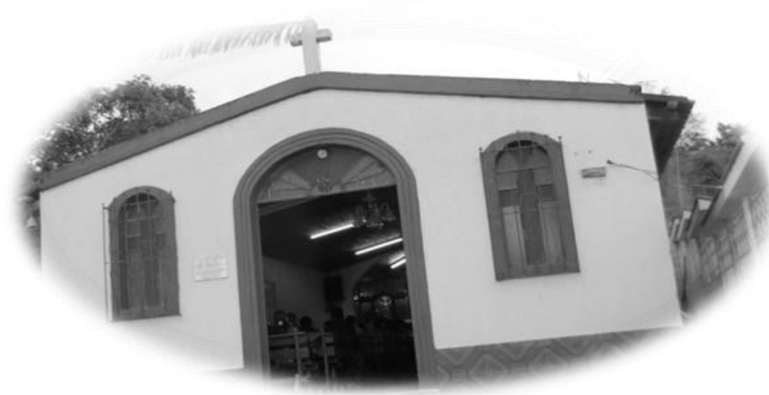
Iglesia Católica, aldea Paquip, Santa Clara La Laguna, Sololá.