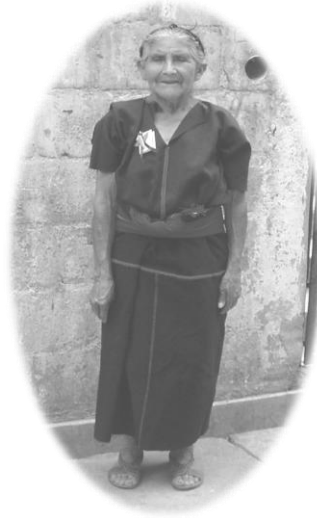
Ejemplar del vestuario utilizado por mujeres del municipio de Santa Clara La Laguna,

El color oscuro significa la noche, el color rosado, significa la alegría de la vida, y la faja roja de la cintura significa el color de la sangre del ser humano. Algunas personas adultas mayores visten aun el traje regional del municipio.