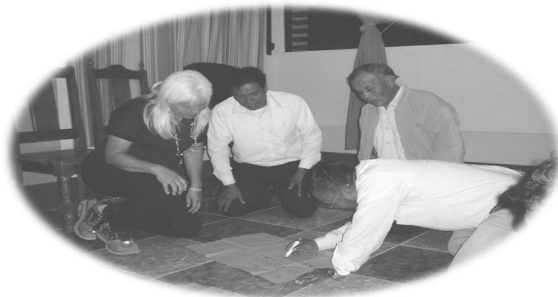
Ejemplificación de la metodología utilizada en el proceso de sensibilización sobre equidad de género a grupos de mujeres, impartido a autoridades municipales de Santa Clara La Laguna, Sololá.