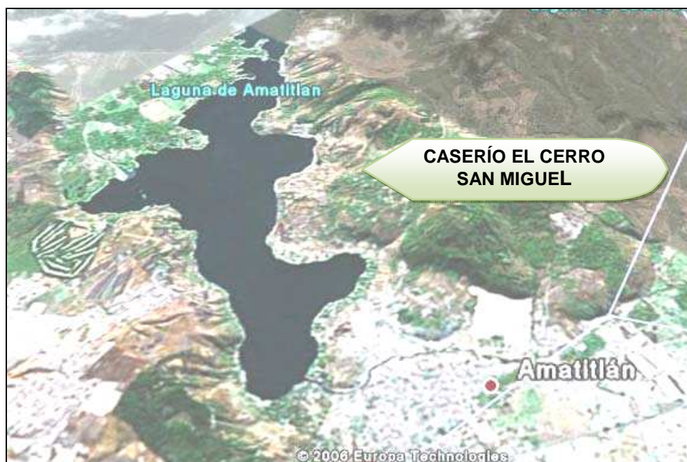
Imagen satelital del caserío El Cerro

Los límites donde se encuentra el caserío El Cerro son: al norte de Guatemala, al este del Municipio de Villa Canales, al sur de Amatitlán y al oeste del Municipio de Villa Nueva.