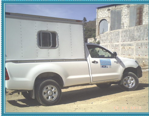
Fotografía No. 23