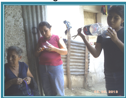
Fotografía No. 16