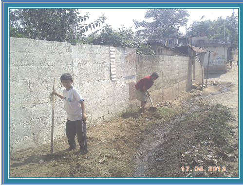
Fotografía No. 27