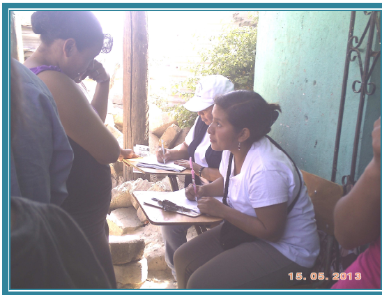
Fotografía No. 25