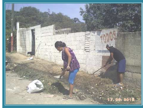
Fotografía No. 28