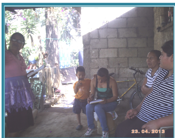
Fotografía No. 10