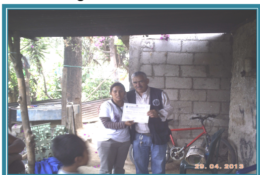
Fotografía No. 14