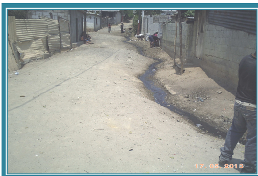
Fotografía No. 31