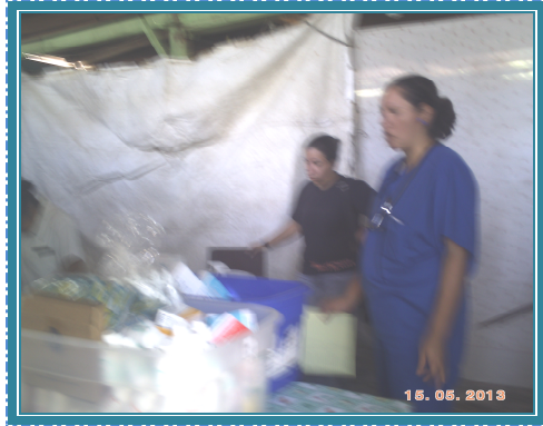
Fotografía No. 24