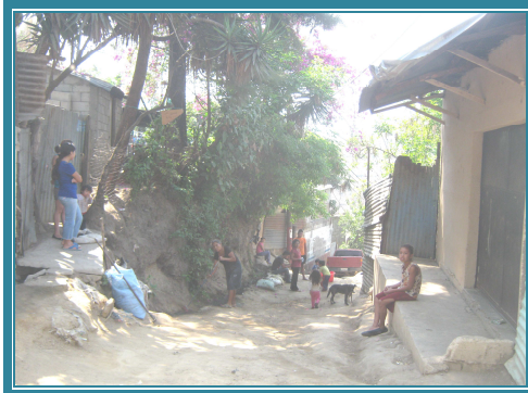
Fotografía No. 29