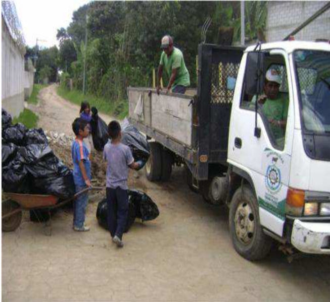
Imagen 6: Recolectores de basura de la municipalidad de San Lucas.

Un claro ejemplo menciona que en Chicamén este año se tenía contemplado la introducción de los biodigestores y no se logró ejecutar porque la comunidad prefirió que se adoquinara la entrada principal, quiere decir entonces que la comunidad aún no se ha empoderado de la importancia del cuidado del medio ambiente, o consideran importante prioritario otras necesidades.