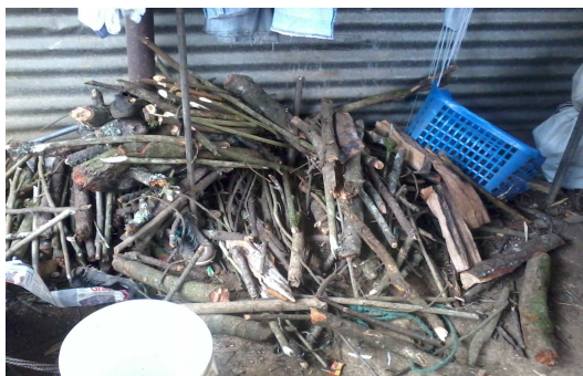
Imagen 5: Leña extraída del Cerro Alux.

Así también, refieren que ellos han visto que en las madrugadas se dan significativas extracciones ilícitas de madera, las cuales son imposibles cuantificarlas y que estos aprovechamientos ilícitos si propician la pérdida de material energético, ya que los que realizan esta actividad aprovechan los mejores árboles dejando como remanentes, los árboles más deformes y enfermos.