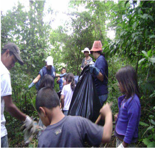
Imagen 6: Faenas de limpieza en Chicamén

proceso se pone en práctica lo que les enseñan, se evidencia en esta investigación que no se ha logrado concientizar a los pobladores ya que al concluir las iniciativas de educación ambiental, los habitantes siguen