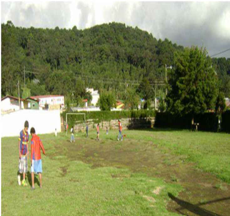
Imagen 7: Campo del señor Reginaldo Rejopachi

con las malas prácticas, de la degradación del medio ambiente, a través de la quema de basura, enterrar la basura sin clasificarla o bien formar vertederos clandestinos en los bosques esperando que el recolector de basura de la municipalidad se la lleve. En algunos casos este fenómeno se da por patrones culturales y en algunos otros casos por no contar con recursos económicos para pagar el servicio de la extracción de basura.