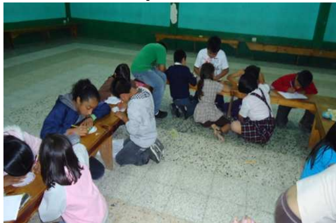
Pre-adolescentes elaborando en parejas una definición de lo que es trabajo en equipo.

La actividad se inició por medio de una técnica de trabajo en equipo la cual consiste en trabajar un juego llamado “basta” en el cual todos los integrantes del grupo debían aportar ideas. Realizando varias técnicas vivenciales acordes al trabajo en equipo y así tener una experiencia más cercana con dicho tema. Se realiza una hoja de trabajo en la cual deben ir resaltando los aspectos que ayudan a contribuir a realizar un trabajo en equipo, luego se deben anotar en el cuaderno del grupo.