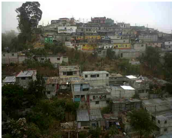
Viviendas del Asentamiento “El Cerrito” zona 7 Ciudad Capital

“El Cerrito” es un asentamiento del municipio de Guatemala, Departamento de Guatemala. Se encuentra ubicado a un costado del puente “El Incienso” en el anillo periférico lado norte de la ciudad capital de Guatemala, con una población aproximada de 3,500 personas, esto según diagnóstico comunitario elaborado en junio de 2010 por la trabajadora social de la institución Buckner Orfam Care Internacional de Guatemala como parte de un estudio social realizado para la apertura del Centro de Transformación Comunitaria.