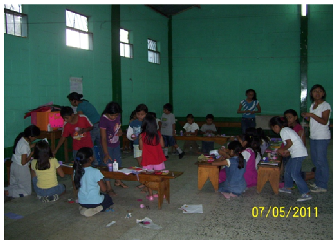
Pre-adolescentes realizando trabajo manual enfocado a resaltar el amor familiar.

La actividad se inicia preguntando cómo está conformada la familia de cada uno de los pre-adolescentes. Realizando preguntas como ¿Por qué es importante el amor en la familia? ¿Qué pasa si no existe el amor familiar?, se les indica que deben copiar un concepto sobre amor familiar además de algunos aspectos para que exista amor familiar, explicando y ejemplificando a la vez cada uno de estos. Se les orienta a escribir en su cuaderno tres actitudes de amor familiar que ellos observen dentro de su núcleo familiar.