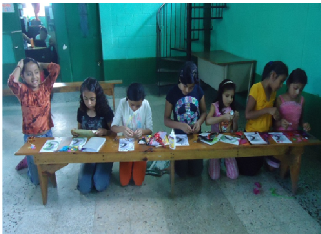
Pre-adolescentes escribiendo metas sobre como vivirán el valor de la alegría en casa y con sus amigos

La actividad se inicia por medio de la convivencia entre los integrantes del grupo; realizando por medio de un rally que consistió en varias técnicas de animación para trabajar en equipo. Es importante mencionar que la reunión se ve afectada por una fuerte lluvia y como se trabaja en el salón comunal y el techo de este es de lámina se tuvo dificultad para concluir la reunión. En el transcurso de las reuniones se ha observado a los pre-adolescente van mejorando sus actitudes dentro del grupo; se observar con facilidad que son más colaboradores, amables, están dispuestos a realizar las actividades demostrando con ello el liderazgo individual.