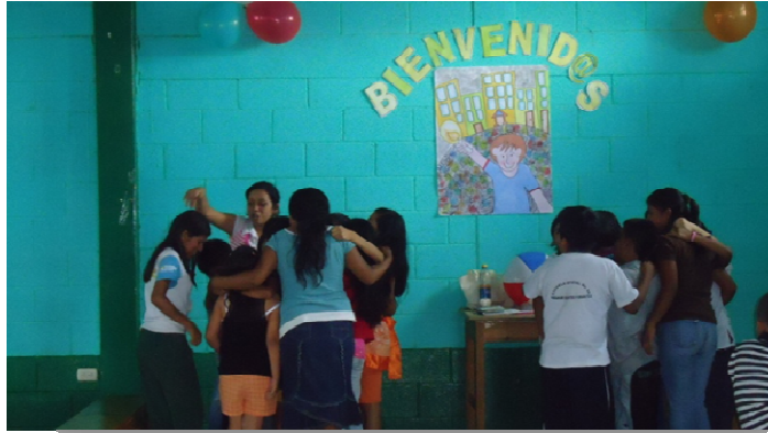
Pre-adolescentes realizando técnicas de integración grupal en la primera reunión realizada

La promoción de la actividad se realizó por medio de carteles colocados en puntos estratégicos de la comunidad, así como de invitaciones personal realizadas a los asistentes del centro de transformación comunitaria, la actividad se realizó en el Salón Comunal del Asentamiento El Cerrito, participaron alrededor de 21 pre-adolescentes de ambos sexos. Se desarrolla la actividad con la realización de diversas técnicas de presentación y animación, posteriormente se realizó una hoja de trabajo donde los pre-adolescentes debían exponer sus ideas para la ejecución de actividades; utilizando diversos materiales como papel de china, crayones marcadores, para luego formar un mural de los trabajos realizados por los pre-adolescentes. Además se realiza una premiación con los trabajos mejores realizados esto a criterio de la epesista de Trabajo Social. Bridando una invitación para participar en la próxima reunión programada indicándoles la hora y el punto de reunión.