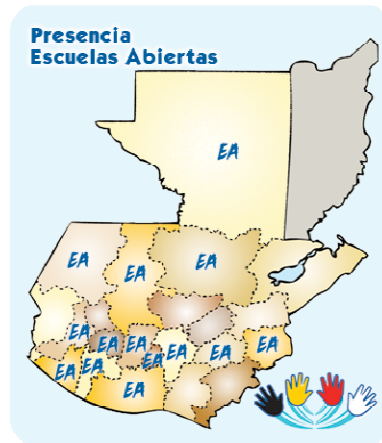
Presencia de las "Escuelas Abiertas" en todo el país.

pobreza, violencia, delincuencia, falta de educación y de oportunidades en general. Las escuelas abiertas les han brindado a los asistentes la posibilidad de verse, repensarse, aceptarse y aumentar su autoestima, así como empoderarse para reducir los factores de riesgo y violencia.