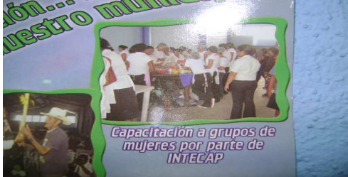
Curso Coordinado por Organización de Municipal de la Mujer