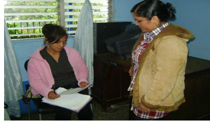
Entrevista realizada a la Coord. de Programas de la OMM