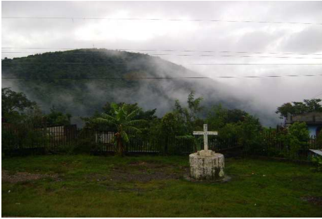
Aldea Jumaytepeque en un día de lluvia