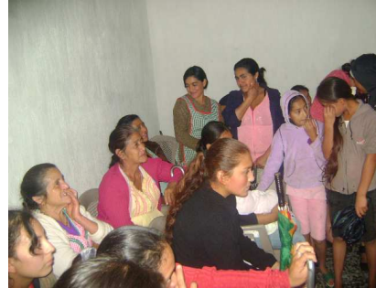
Reunión con mujeres de La comunidad