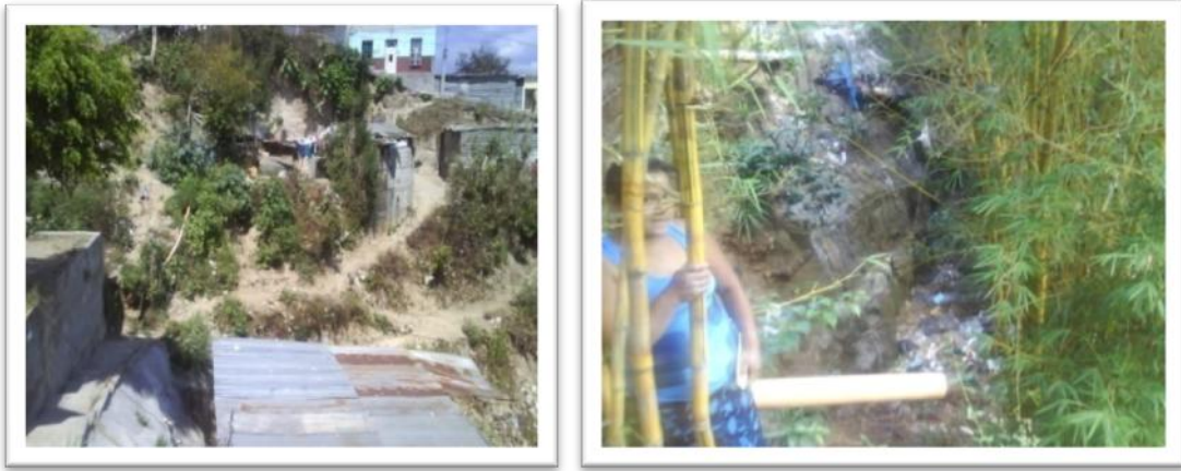
Tierra Nueva II está ubicada en laderas y barrancos

pesar de la ubicación del terreno toda la población hace uso exclusivo de los lotes para vivienda producto de la invasión realizada.