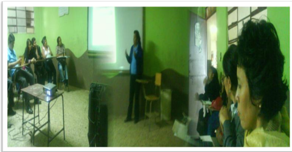
Proceso de evaluación de la participación y organización de la comunidad educativa de la Escuela Oficial Asentamiento Tierra Nueva II, Chinautla.