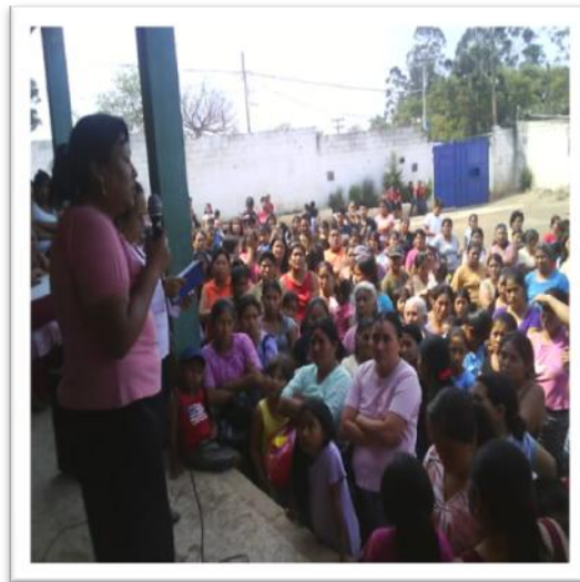
Socialización del proyecto, Padres y madres de familia, Escuela Tierra Nueva II.