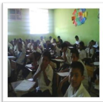
Capacitación de niños (as) promesa, tema: “Manejo adecuado de la basura” Aula de Escuela Asentamiento Tierra Nueva II.