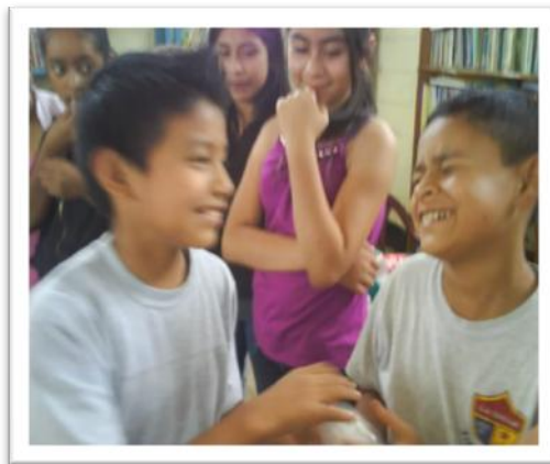
Socialización del tema Trabajo en Equipo, grupo de niños y niñas Promesa, Salón de clases, Escuela Asentamiento Tierra Nueva II.