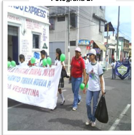
Caminata Día Mundial de la Tierra, grupo de niños y niñas Promesa.