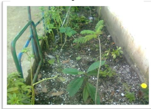
Espacio jardinizado de la Escuela Asentamiento Tierra Nueva II.