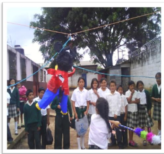
Clausura del proyecto de Medio Ambiente, grupo de niños y niñas Promesa, Escuela Asentamiento Tierra Nueva II.