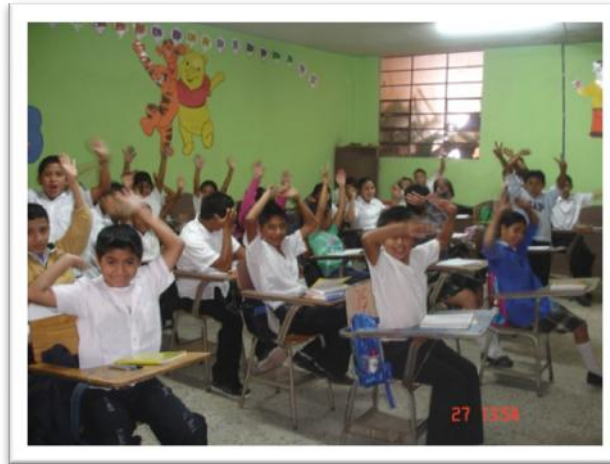
Grupo de niños y niñas Promesa tema de medio ambiente. Escuela Asentamiento Tierra Nueva II.