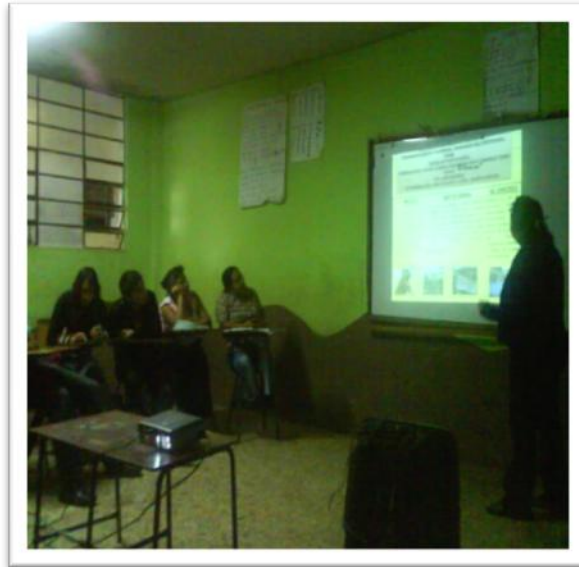
Socialización de resultados de Proyecto de Cuidado Medio Ambiente en la Escuela Asentamiento Tierra Nueva II.