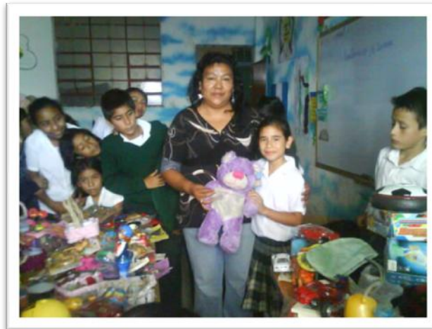
Clausura del proyecto de Medio Ambiente, grupo de niños y niñas Promesa, Escuela Asentamiento Tierra Nueva II.