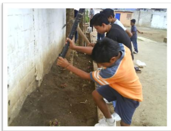
Jardinización de arriates, niños de sexto primaria, escuela Asentamiento Tierra Nueva II.