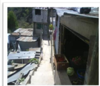
Vivienda en alto riesgo, Tierra Nueva II