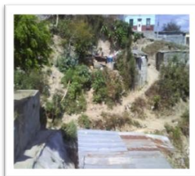
Vivienda en alto riesgo, Tierra Nueva II.