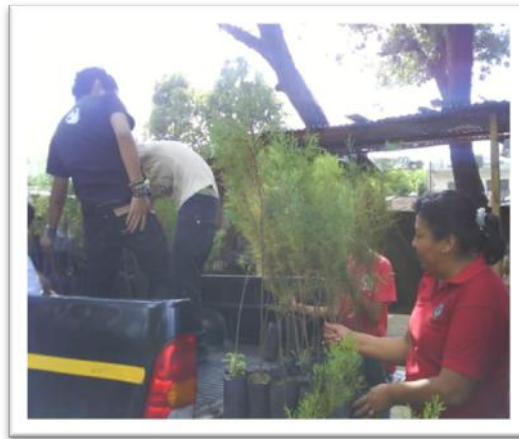
Traslado de árboles, grupo de jóvenes