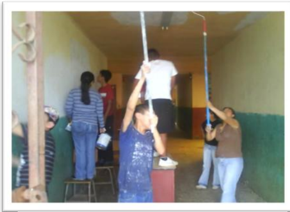
Padres de familia pintando la escuela.