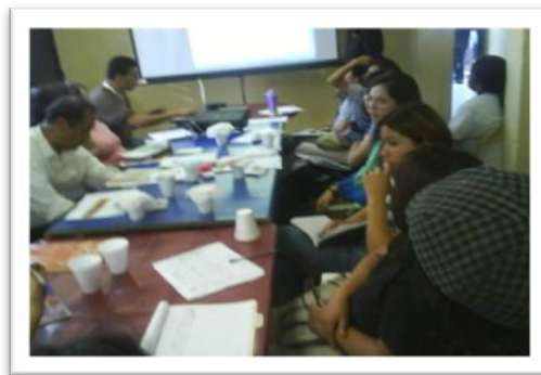
Mesa Multisectorial de Tierra Nueva II

La participación activa de la población, desde la invasión de Tierra Nueva II, la legalización de los terrenos, la mejora barrial, son iniciativas que van creando la unidad y apoyo de un frente en búsqueda del desarrollo integral para sus familias y comunidad en general.