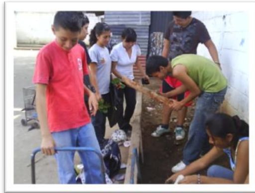
Grupo de jóvenes de Espacios Amigables, jardinizando Escuela Asentamiento Tierra Nueva II.