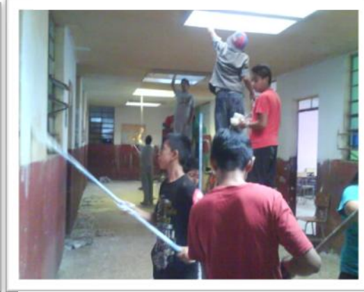
Grupo de niños Promesa pintando la escuela, Asentamiento Tierra Nueva II.