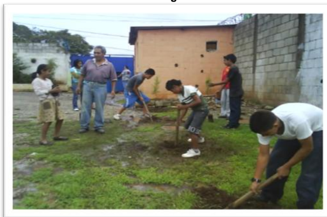
Reforestando patio de escuela Asentamiento Tierra Nueva II.