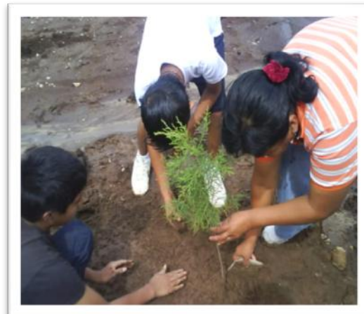
Reforestación, niños de 6to primaria