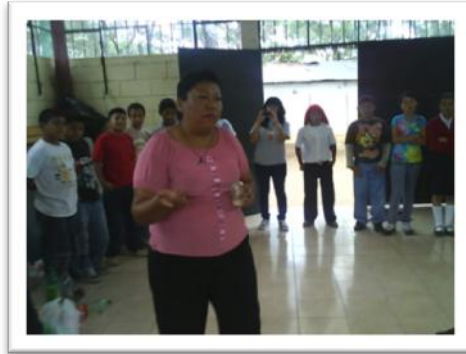
Capacitación del tema: Proceso de grupo, a grupo de “Niños y niñas Promesa” Salón de clase Escuela Asentamiento Tierra Nueva II.