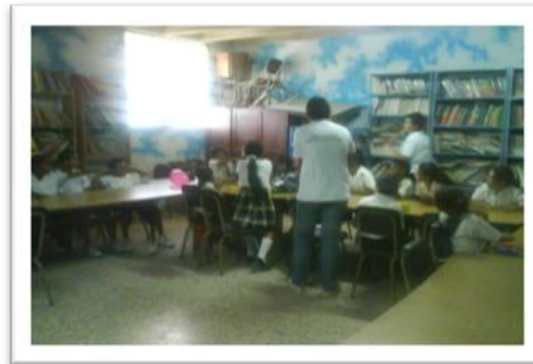
Socialización del tema Liderazgo, grupo de niños y niñas Promesa y Espacios Amigables. Biblioteca de la Escuela Asentamiento Tierra Nueva II.