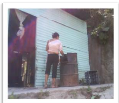
Vecina de Tierra Nueva II

Se puede apreciar la ubicación de alto riesgo y vulnerabilidad de las viviendas de Tierra Nueva II