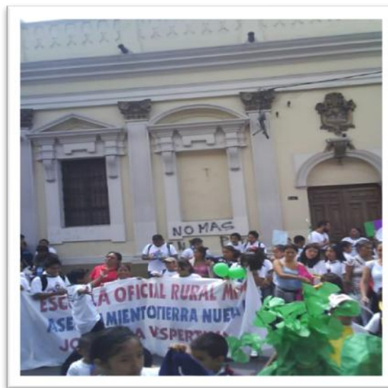
Estudiantes de la Escuela Tierra Nueva II en caminata del Día Mundial de la Tierra, frente al edificio del Congreso de la República de Guatemala