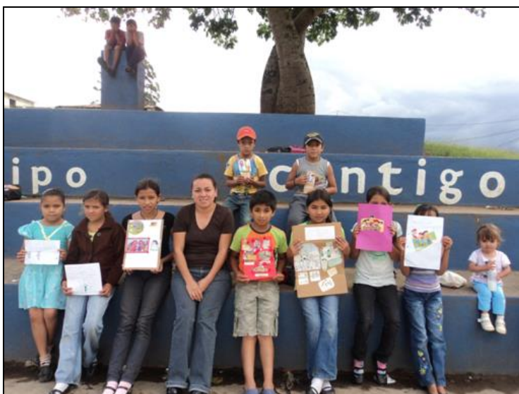
Fotografía 4: Elaboración de carteles utilizados para la exposición del tema los valores.

Los infantes compartieron algunos valores muy arraigados que tienen sus familias, en los que cabe mencionar, la honradez, la solidaridad, sinceridad, entre otros.