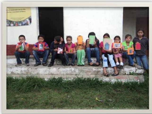
Fotografía 6: Porta retratos elaborados con materiales reutilizables, luego de la exposición del tema “La importancia del reciclaje”.

La falta de mobiliario fue una limitante, ya que por la cantidad de niños y niñas, la única mesa que hay en la sede fue insuficiente para que los infantes hicieran uso de esta. Sin embargo la epesista y los integrantes del grupo se las ingenieron para sacar adelante esta actividad.