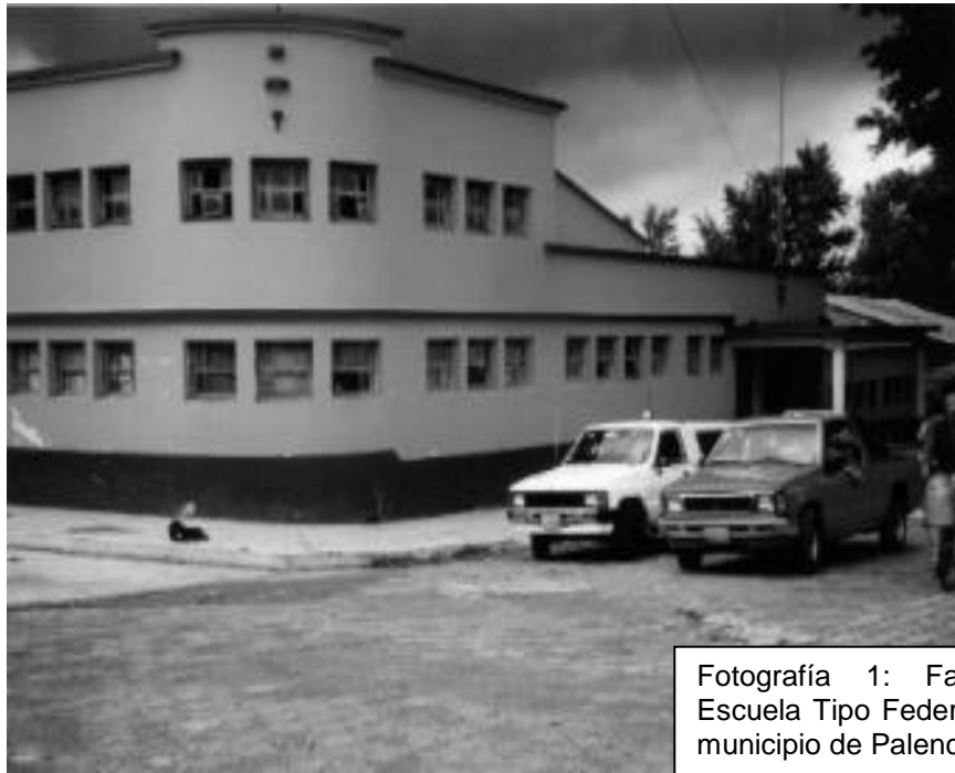
Fotografía 1: Fachada de la Escuela Tipo Federación No. 1 del municipio de Palencia