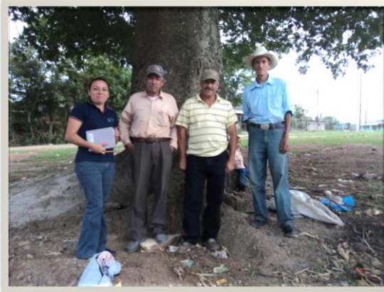
Fotografía 7: Coordinación de la epesista con autoridades locales de la comunidad el Paraíso, previo a la actividad de reforestación.

Se contó con el apoyo del presidente del cocode y del Alcalde Auxiliar de la comunidad, para el desarrollo de algunas actividades, quienes en su momento autorizaron la realización de actividades, específicamente la siembra de 100 arbolitos en el terreno municipal de la comunidad el Paraíso.