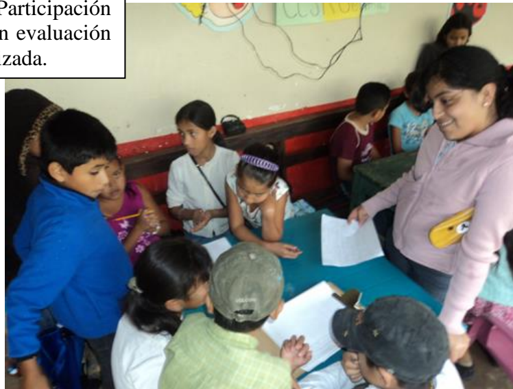
Fotografía 8: Participación de los infantes en evaluación de actividad realizada.

Para la etapa de evaluación se realizaron actividades en las cuales se contó con la participación de los niños y niñas del grupo, así como de los padres de familia en actividades específicas.