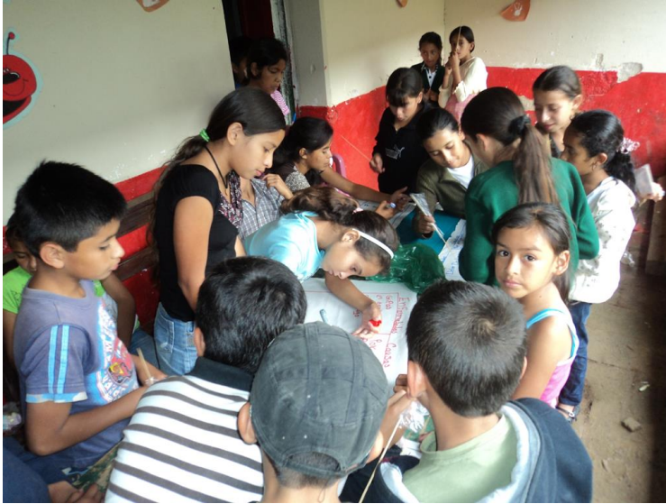
Fotografía 5: Elaboración de la olla familiar durante el abordaje del tema la “Alimentación y nutrición”

Asimismo, se concientizó a los niños y niñas del grupo, para que pusieran en práctica lo aprendido durante esta reunión, y de esta forma se convirtieron en agentes multiplicadores.