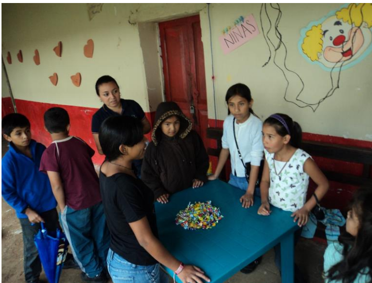
Fotografía 2: Los infantes compartieron algunos dulces para realizar la actividad de la piñata.

Todos los niños y niñas, cumplieron con traer algunos dulces para compartir con los miembros del grupo y pasar un momento de convivencia y darle la bienvenida al grupo.