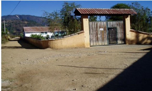
Fotografía tomada por la estudiante de EPS María Yaqui Centro Monte Cristo Febrero, 2013.

CEMOC apoya a escuelas públicas de 51 comunidades, ejemplo de ello es la provisión de mobiliario para cocina; provee de desayunos nutritivos a las y los niños de la escuela primaria de Monte Cristo. Otro, es la compra de una bomba y de repuestos para la reparación de la tubería de los sanitarios de esta misma escuela. Así como la contratación de una maestra financiada por la Cooperativa Kato-ki.