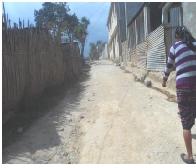
Fotografía tomada por la estudiante de EPS María Yaqui. Febrero 2013.