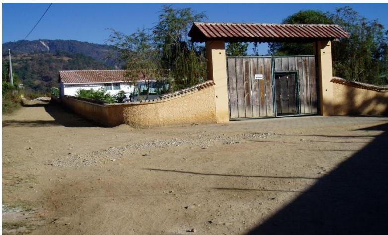
Fotografía tomada por la estudiante de EPS María Yaqui, Centro Monte Cristo Febrero, 2013.

Cabe resaltar que de la población en edad escolar para los grados de educación básica, la mayoría no continúan sus estudios por distintas razones, tales como: