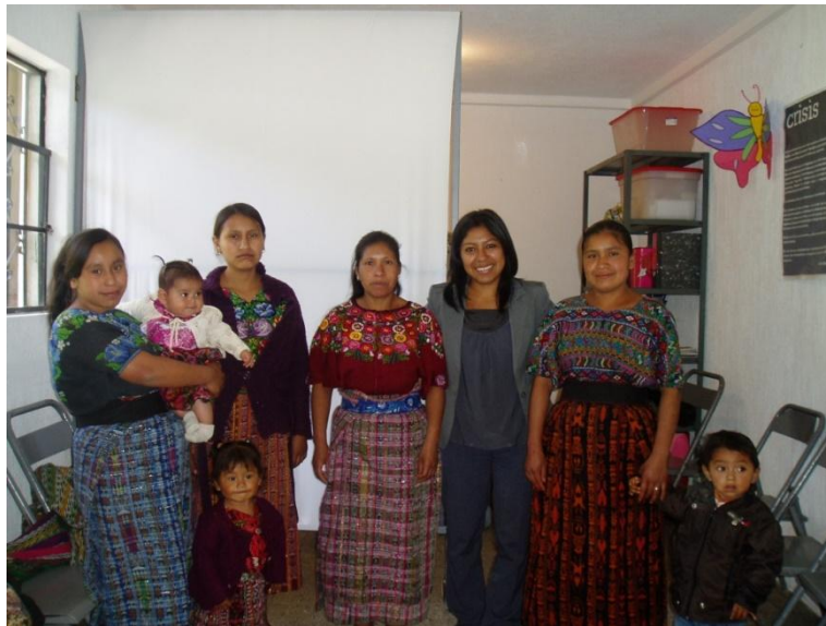
Lideresas del Grupo de Mujeres de Monte Cristo. Marzo 2013.

Al investigar cuánto la comunidad conoce las funciones del grupo de mujeres, dijeron: