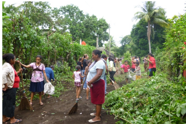
Realizando la limpieza de la colonia Banvi.

Tercera reunión; se llevó a cabo en el mismo espacio físico de la propiedad de la presidenta de la red de mujeres, inició a las 14:30 pm con 20 mujeres, se da lectura a la agenda, la cual estaba estructurada de la siguiente forma: presentación, bienvenida, técnica de rompe hielo, desarrolló del tema. “Enfoque político pedagógico y la importancia del trabajo en equipo”, acuerdos y evaluación.