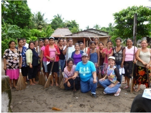
Inicio de tren de limpieza en coordinación con autoridades, líderes/as y familias de la colonia Banvi.