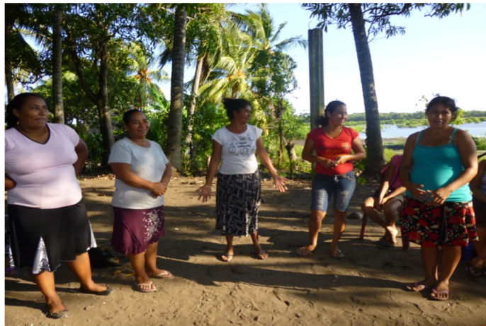
Taller sobre el enfoque político pedagógico y trabajo en equipo.

Cuarta reunión se llevó a cabo en el lugar de siempre, dando inicio a las 14:30 pm con la oración, lectura de agenda, la cual estaba estructurada de la siguiente forma: bienvenida, presentación, desarrollo del tema. La interacción social y comunicación de aprendizajes, acuerdos y evaluación.