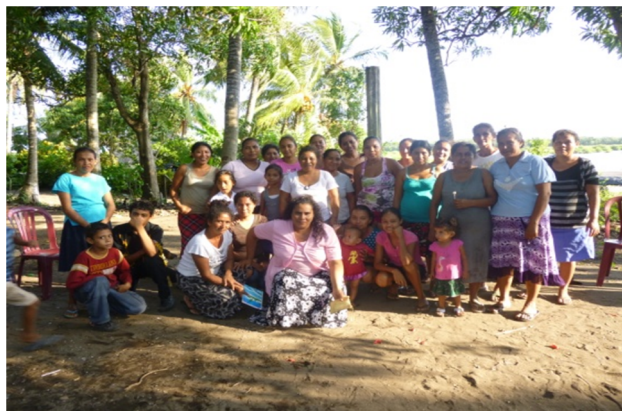
Taller sobre interacción social y comunicación de aprendizajes.