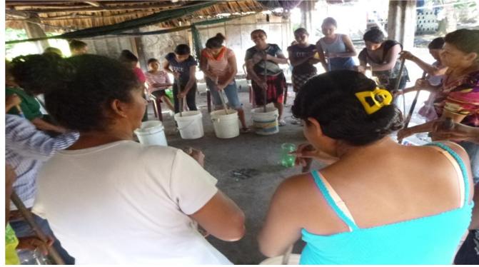
Taller sobre redes comunitarias.

Octava reunión; se llevó a cabo en el mismo lugar, dando inicio a las 14:30 pm, con la lectura de la agenda de la siguiente forma: presentación, bienvenida, técnica de rompe hielo, el tema a tratar fue “Gestión y autogestión comunitaria”, acuerdos y evaluación.