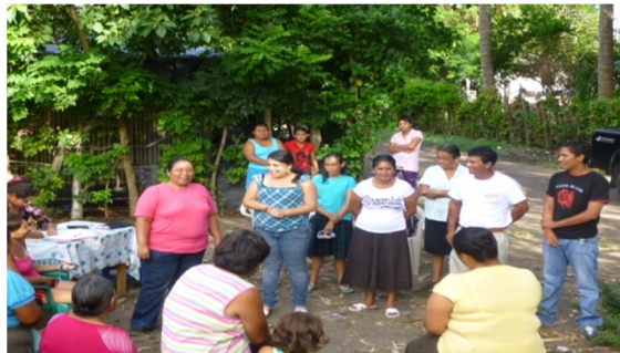
Socialización del diagnóstico comunitario.