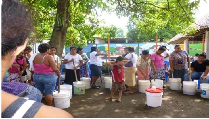
Taller de capacitación sobre Gestión, autogestión comunitaria