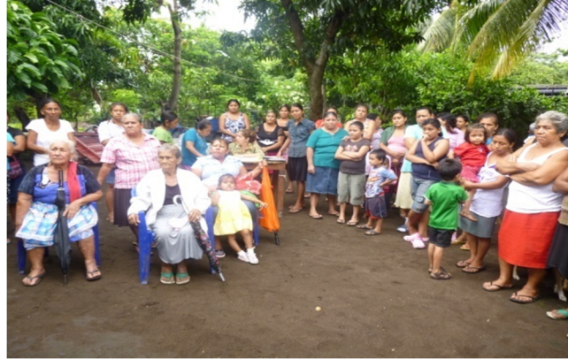
Taller sobre organización comunitaria y estructura organizativa

Séptima reunión; se llevó a cabo en el mismo lugar, dando inició a las 14:30 pm, con la lectura de la agenda de la siguiente forma: presentación, bienvenida, técnica de rompe hielo, el tema a tratar fue “Red comunitaria, redes sociales y red de mujeres”, acuerdos y evaluación.