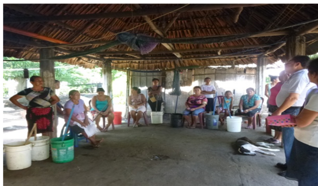
Taller sobre los derechos de las mujeres.