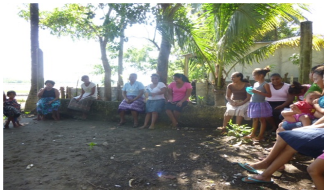
Primera reunión con la red de mujeres, donde se imparte el tema de mujer como actor fundamental en el desarrollo comunitario.

Segunda reunión, 27 de septiembre del 2014 se llevó a cabo en un espacio ubicado en la propiedad de la presidenta de la red de mujeres, dando inicio a las 8:00 am, con la participación de 40 mujeres y 18 niños de la comunidad, iniciando con una oración y lectura de la agenda, la cual estaba estructurada de la siguiente forma: presentación, bienvenida, técnica de rompe hielo, desarrollo del tema, “contaminación ambiental”, evaluación y acuerdos.