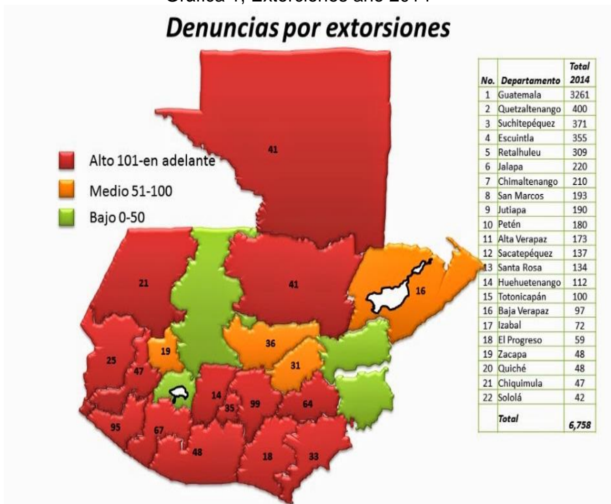
Gráfica 1, Extorsiones año 2014