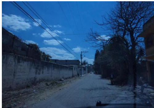
Foto 1, Calle de la Colonia Los Álamos.

En el año 1950 la Colonia Los Álamos, formaba parte de una finca perteneciente a la Familia Murga, donde se cultivaba sandía, cebolla, tomate, café y caña.