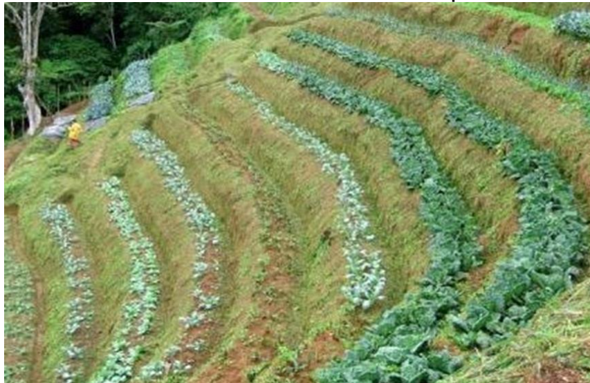
Curvas a nivel elaboradas en las altas pendientes