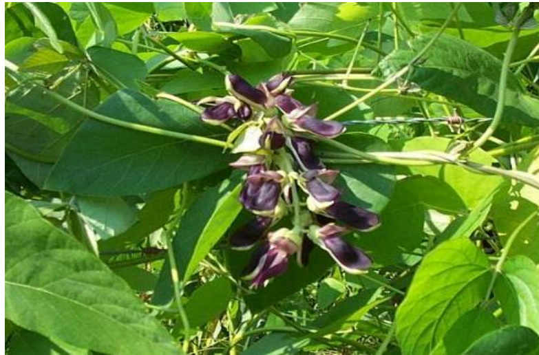
Plantación del café de abono