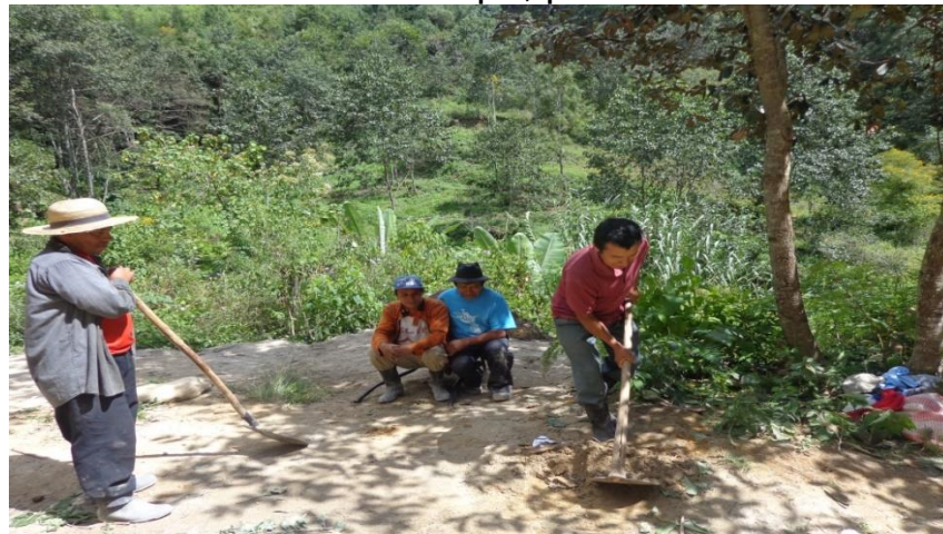
Uso de las cañas de milpa, para abonar el suelo