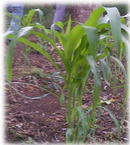
Fotografía 1 Principal producto de consumo familiar