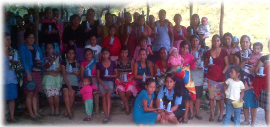
Fotografía 20 Taller de manualidad con el grupo de mujeres Elaboración de velas con detergente