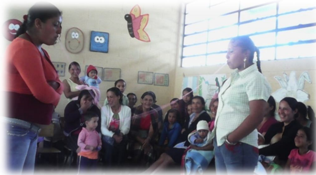
Fotografía 23 Convivio navideño con el grupo de mujeres