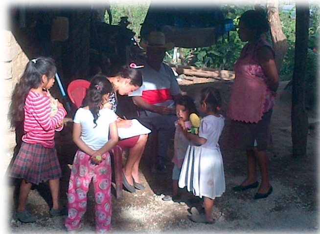
Fotografía 2 Condición de salud

Fuente: Tomada del archivo de la autora. Año 2014