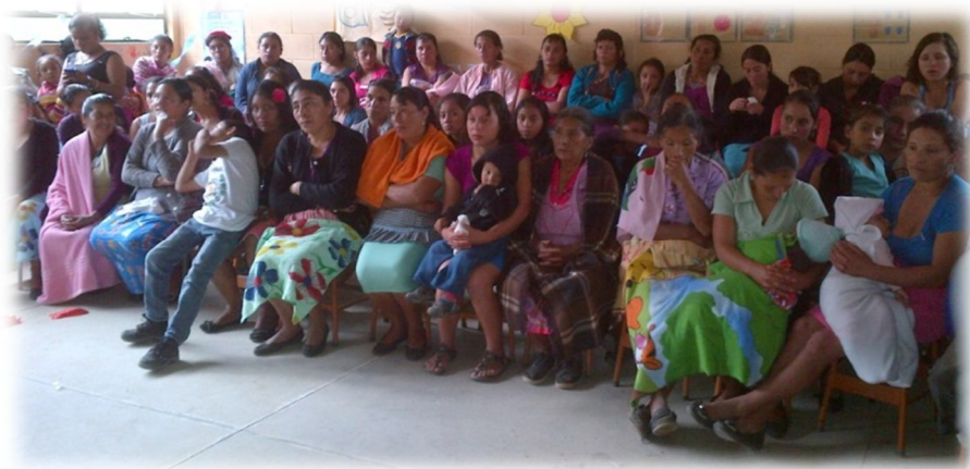
Fotografía 11 Capacitación al grupo de mujeres sobre participación comunitaria