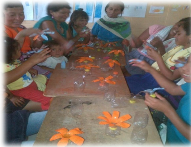
Fotografía 19 Taller de manualidad con el grupo de mujeres Elaboración de flores con botellas plástica