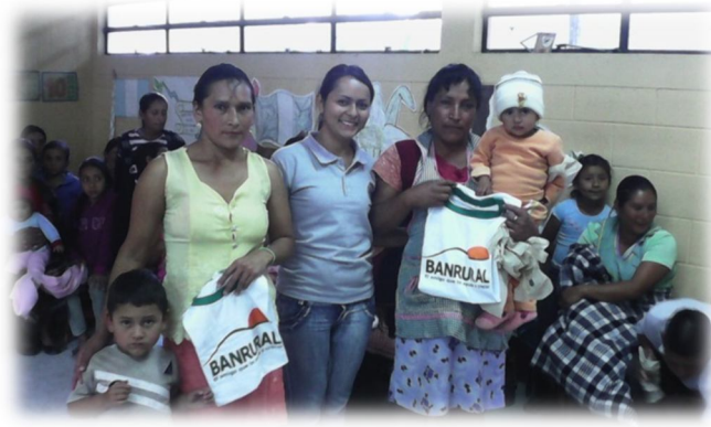
Fotografía 24 Convivio navideño con el grupo de mujeres

realización de actividades socioeducativas y culturales implementadas dentro de la comunidad.