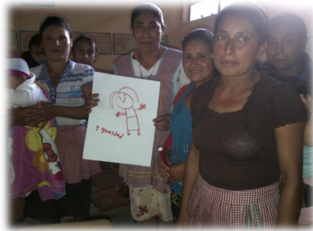
Fotografía 14 Capacitación al grupo de mujeres sobre Igualdad de género