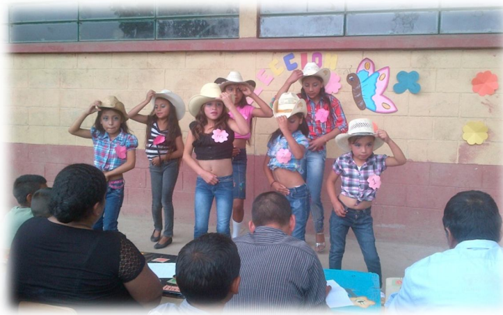
Fotografía 5 Actividad cultural

Año 2014