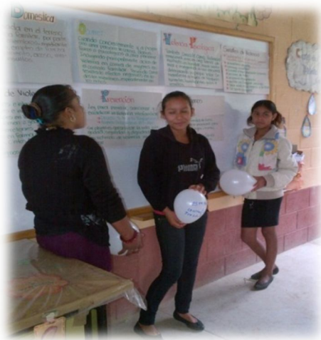
Fotografía 17 Capacitación al grupo de mujeres sobre Violencia doméstica