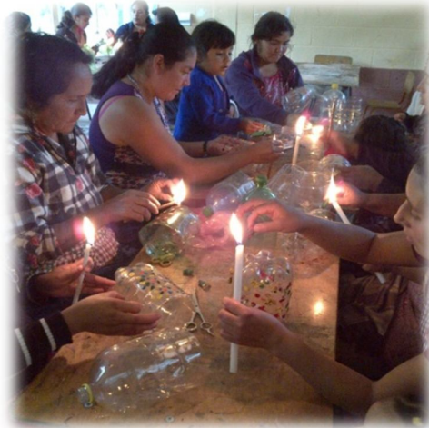
Fotografía 22 Taller de manualidad con el grupo de mujeres Elaboración de floreros plásticos con crayón de cera