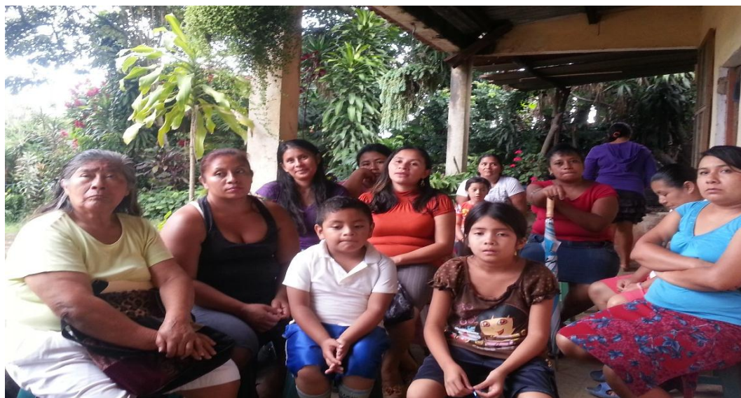
Imagen 1 Reunión con miembros del COCODE