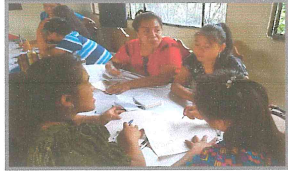
Fotografías 6 y 7. Integrantes del grupo juvenil durante actividad del tema de salud sexual.