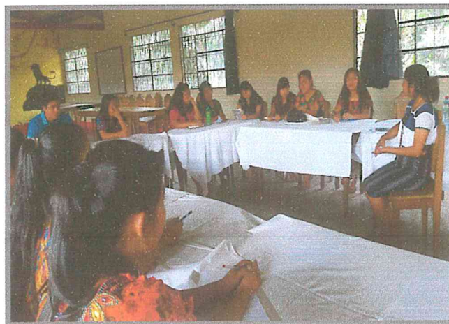
Fotografía 5. Estudiante de EPS durante la socialización del tema de salud sexual. Experiencia sistematizada 2016