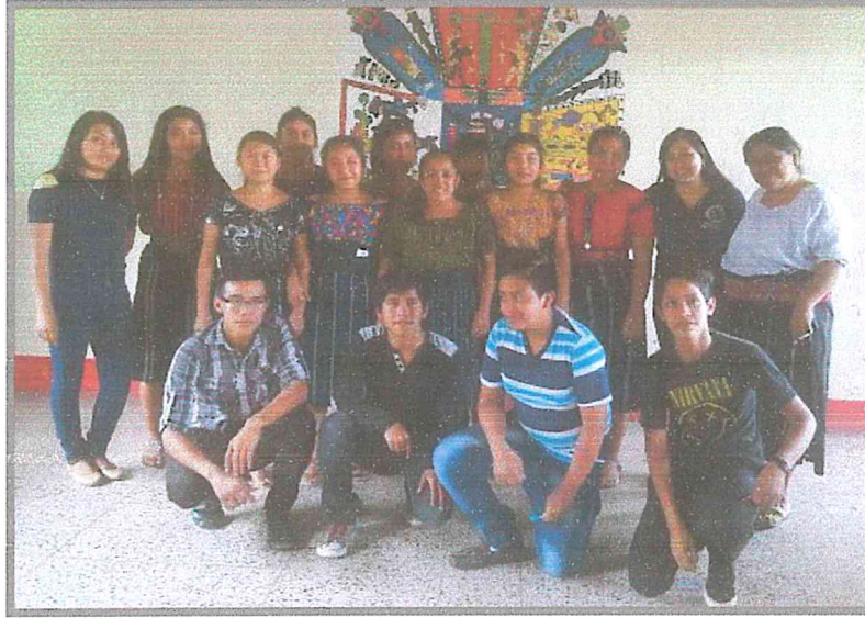
Fotografía 1. Integrantes del grupo juvenil Qawinaqel, a la derecha la dirigente de la Organización Qawinaqel y la estudiante de EPS. Experiencia sistematizada 2016.