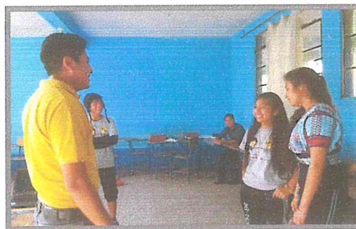
Fotografía 11. Técnica del socio-drama sobre la prevención del riesgo de embarazos en niñas y adolescentes realizado por uno de los grupos. Experiencia sistematizada 2016

Se logró evidenciar un mayor conocimiento en el grupo juvenil de acuerdo a los resultados de las actividades de evaluación, identificaron las principales causas y efectos de los embarazos en niñas y adolescentes, el grupo logro crear un listado de acciones como puntos de prevención que pueden ser aplicados en la convivencia cotidiana dentro del círculo de amigos, familia, vecinos etc.