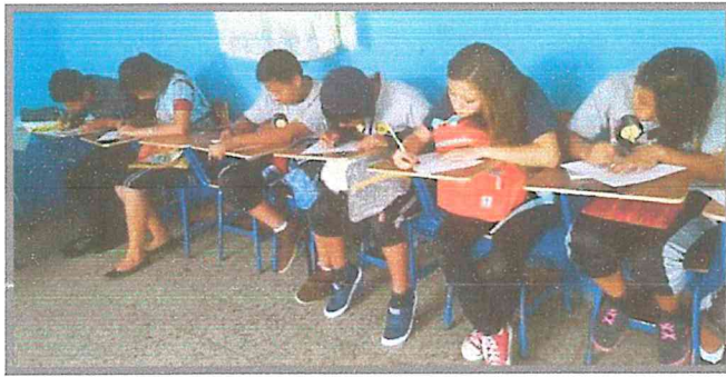
Fotografía 12. Grupo juvenil Qawinaqel respondiendo el cuestionario de evaluación.