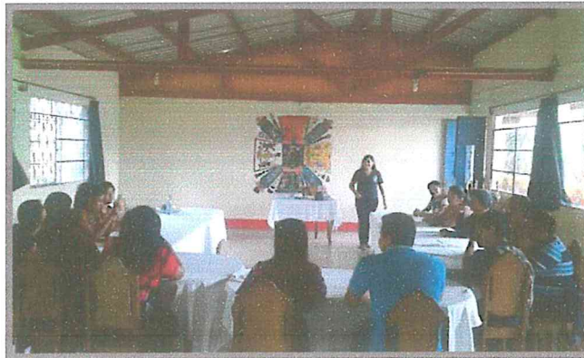
Fotografía 4. Facilitadora con el grupo Juvenil Qawinaqel. Experiencia sistematizada 2016

uno de otro, también realizó una reflexión tomando la participación de los integrantes del grupo juvenil acerca de los nahuales y la relación que estos tenían con respecto a la educación sexual.