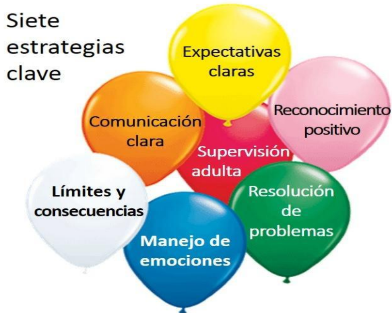
Figura 1 Estrategias claves de Miles de Manos Metodología para la prevención de la violencia