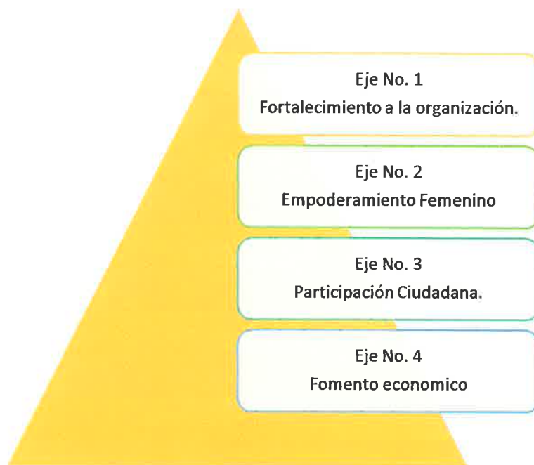
Figura 1 Se muestran los cuatro ejes estratégicos de trabajo para la implementación de la propuesta metodológica de seguimiento.