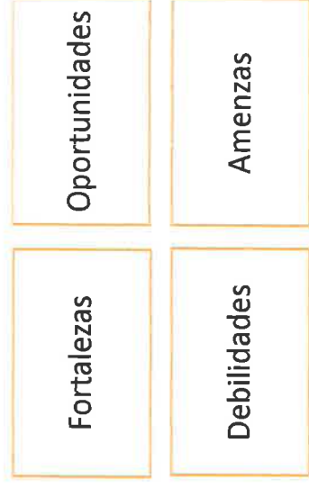
Figura 4 Se muestra la técnica que se utilizara para la evaluación final de la ejecución de la propuesta metodológica de seguimiento.