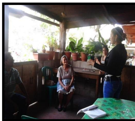
Ilustración 4 Informe Ejercicio Profesional Supervisado 2016

Esta actividad fue muy motivadora ya que evidenció que se encuentran comprometidos con el desarrollo de comunidad, posterior a ello la representante de la municipalidad les felicitó e hizo entrega del libro de actas y los carné que les acredita como miembros legales del Cocode mismo acto que fue emotivo pues tenían mucho tiempo realizando la gestión y no se había podido concretar.