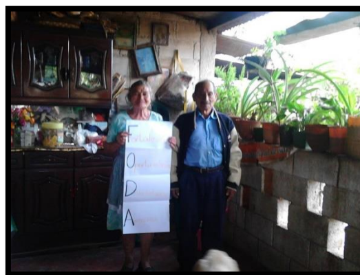
Ilustración 3 Informe Ejercicio Profesional Supervisado 2016

Este tema en particular dejó un aprendizaje sumamente significativo puesto que el hecho de lograr generar un nuevo aprendizaje, concientizar y empodera a los líderes comunitarios es enriquecedor para el desarrollo endógeno de la comunidad de Guillen ya que ellos mismos son los actores de cambio y agentes multiplicadores del aprendizaje, pues contando con herramientas para trabajar y aunado a su experiencia su trabajo tendrá mucho que aportar al desarrollo comunitario.