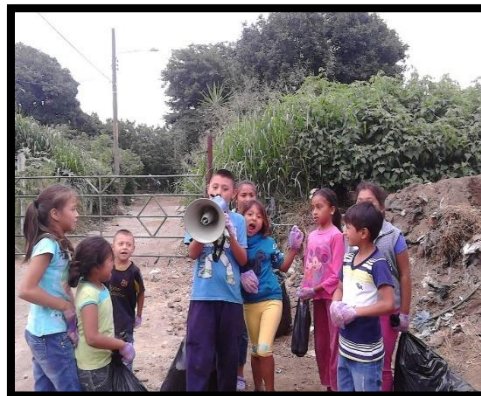
Ilustración 5 Informe de Ejercicio Profesional Supervisado 2016

Los integrantes del Cocode fueron descubriendo que eran capaces de impulsar, crear y llevar a cabo proyectos que les beneficien, en la actualidad año 2018, producto de sus gestiones, la municipalidad está por iniciar la instalación de drenajes y la pavimentación de la calle principal de la comunidad, esto será posible ya el trabajo del Consejo sigue en pie.