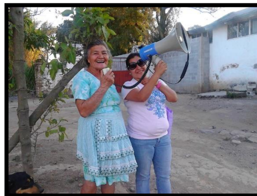
Ilustración 1 Informe de Ejercicio profesional Supervisado 2016