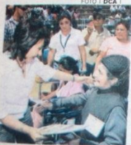
APOYAR los programas sociales es reafirmar la justicia social, indicó Sandra Torres en un acto celebrado en el parque La Democracia.

Un total de 2,116 familias fueron beneficiadas con títulos de propiedad, lo que les dará certeza legal sobre los terrenos que habitan. La actividad constituye la quinta entrega de dichos documentos y se llevó a cabo en 121 comunidades de los departa-