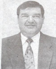
Diputado Rafael Barrios Flores.

Hizo ver el ponente que, en diversos estudios e investigaciones realizadas por la Organización Panamericana de la Salud y la Organización Mundial de la Salud, se señala que residuos hospitalarios pueden producir efectos indeseables para la sa-