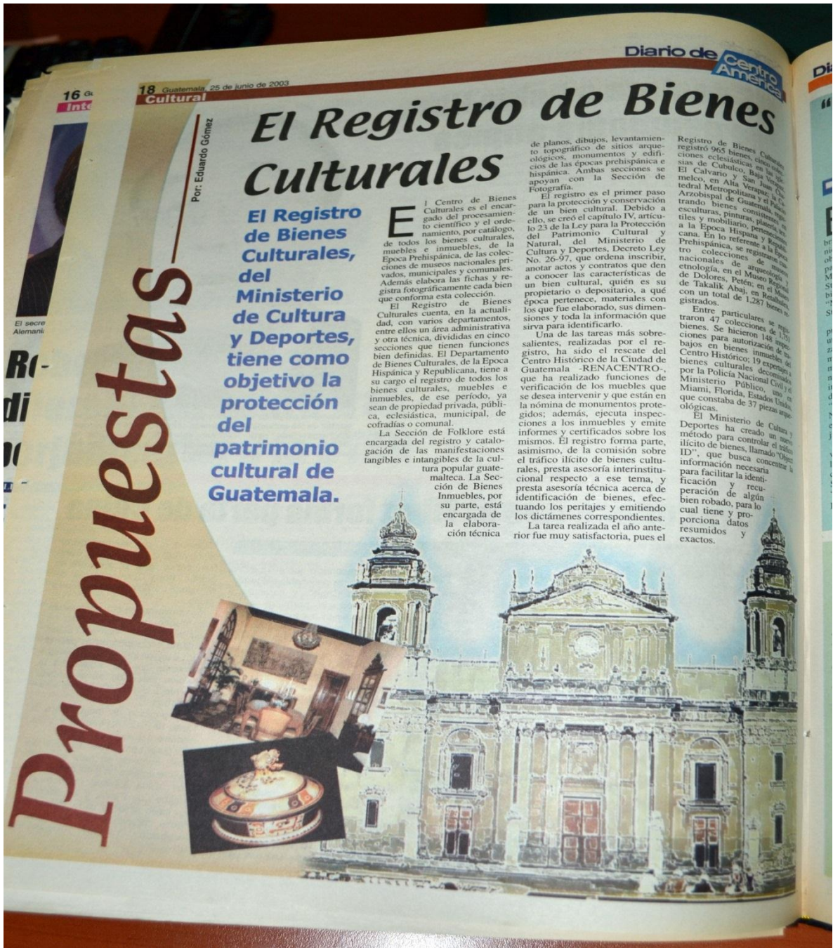
En esta fotografía se puede observar una página de la sección cultural, que tuvo un cambio de diseño y estructura para ilustrar mejor el material, se colocó entradilla utilizando otro color y tipología en el texto para diferenciarla y dar un realce a la página diagramada, lo que llevó a que cada sección contara con un color para identificarla.