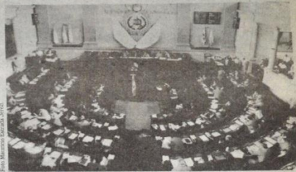
La elección de magistrados, titulares y suplentes, a la Corte de Constitucionalidad, se hará conforme lo establece nuestra Constitución Política, afirmó el Presidente del Organismo Legislativo, Diputado Efraín Ríos Montt, para luego reiterar que la elección se hará conforme la norma constitucional.

de documentos de los aspirantes y, después del estudio correspondiente, serán ellos los que trasladarán dichos documentos al Pleno parlamentario, en donde cada diputado expresará su voluntad mediante el voto. Consideró que podría haber una planilla única con el nombre de todos los aspirantes, porque sería muy difícil realizar una depuración como piden algunos grupos, ya que no podrían definirse los parámetros. ¿Depurar? ¿A la ley de qué? ¿Quién será el ejemplo? ¿Quiénes de las interrogantes que planteó el Presidente del Organismo Legis-