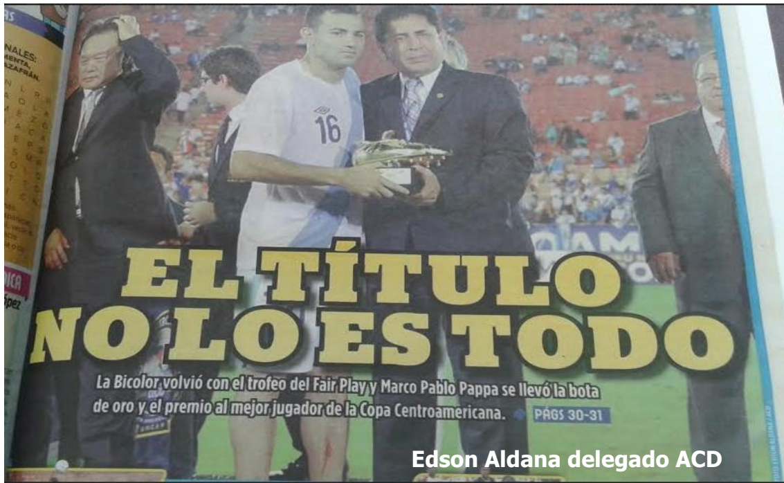
Reconocimiento a Marco Pappa, Bota de Oro