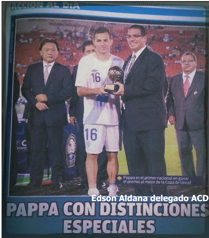
Marco Pappa, premio al mejor jugador de la Copa Uncaf 2014