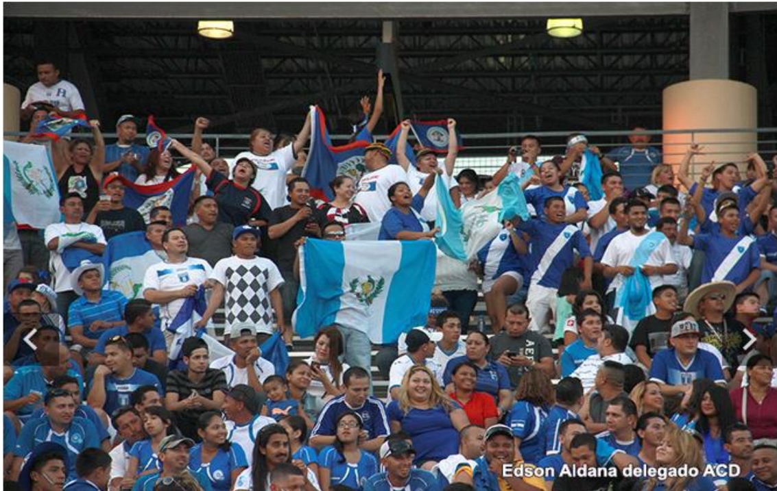
Bandera de Guatemala, entre los aficionados, Uncaf 2014