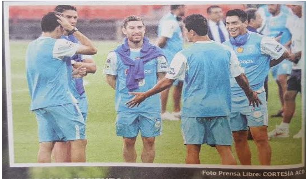
Entrenamiento de la Selección Nacional de Guatemala