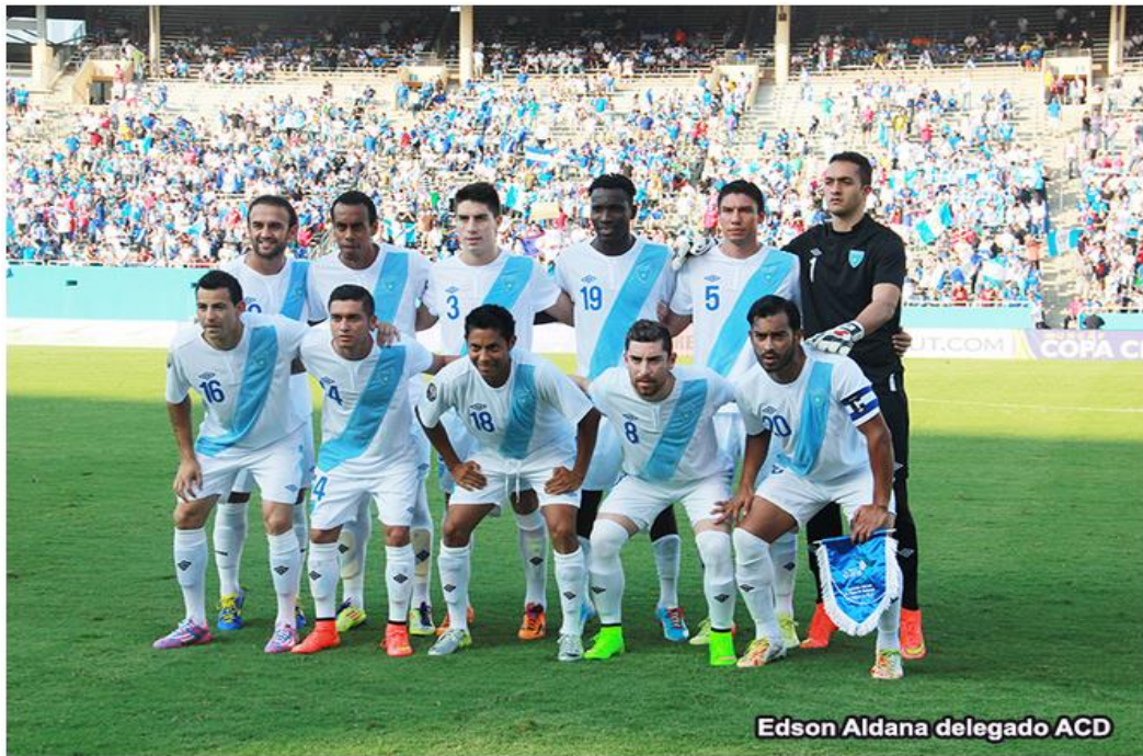
Selección Nacional de Guatemala 2014