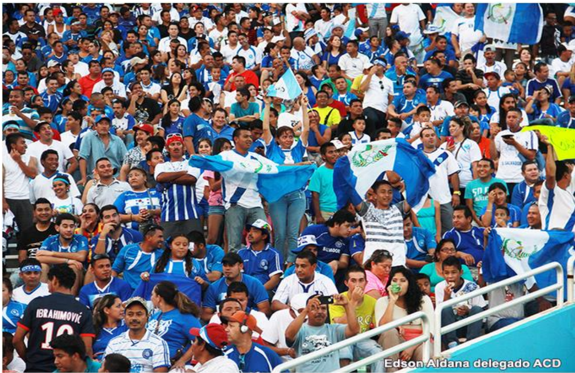
Aficionados apoyando desde las gradas a la Selección de Guatemala