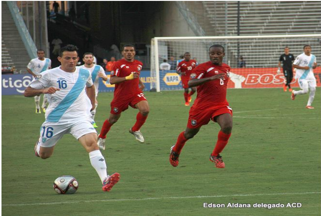
Marco Pappa, delantero selección nacional de Guatemala