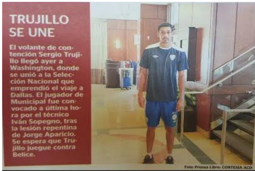
Sergio Trujillo, seleccionado de la selección nacional