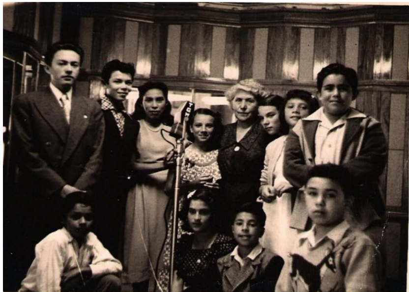
Estudio de Cristal TGW