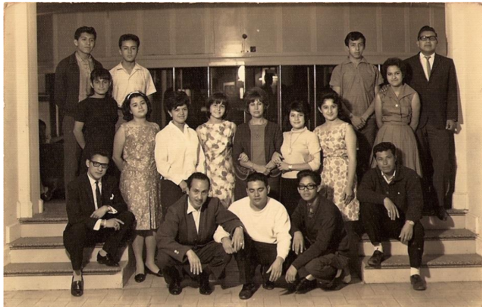
Primer grupo del Radioteatro Infantil, en su decimosegundo aniversario, 1963