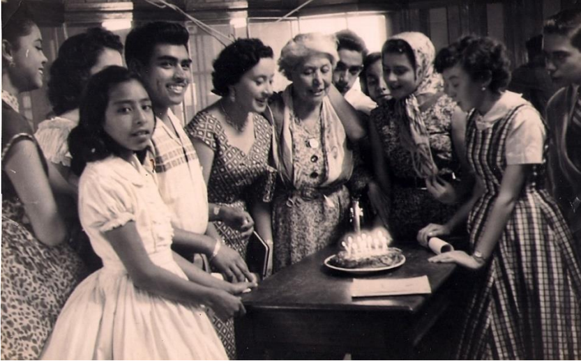
X Aniversario Agosto 18 de 1956