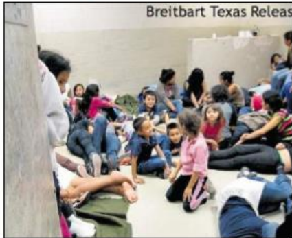
Breitbart Texas Releases

Cooditor de Diseño: David Gil • Diseño: Mauro González • Campaña por de María López • Teléfono: 2402 5600