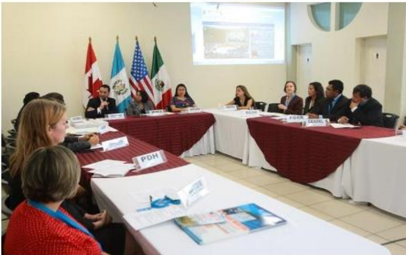
Representantes de la región se reunieron para lanzar la campaña de prevención contra las estafas a migrantes.

Canadá EE. UU. Embajada Engaños Estados Unidos Guatemala México Visa de trabajo