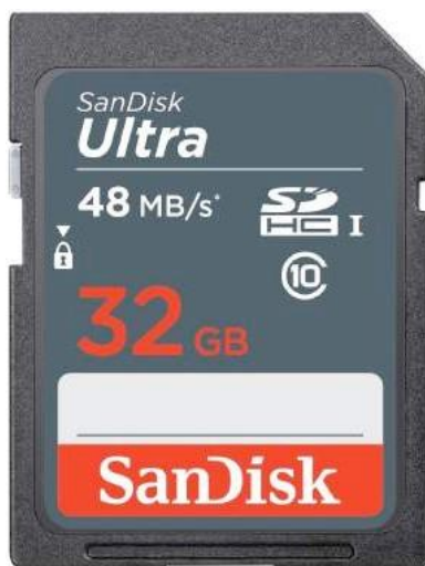
Ilustración 7– Tarjeta SD