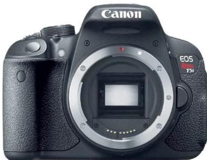
Ilustración 2- Cuerpo de cámara anterior

En el caso específico de esta monografía, en Emisoras Unidas se asignó un equipo completo para realizar las diferentes coberturas estipuladas, se utilizó el cuerpo de una cámara DSLR Canon EOS Rebel T5i.