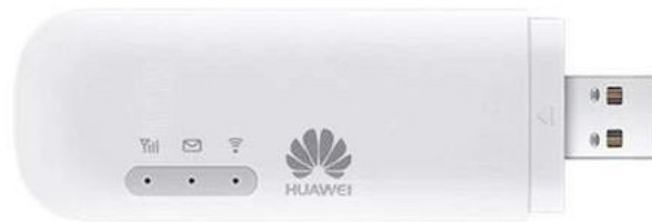
Ilustración 11– Modem Wi-Fi