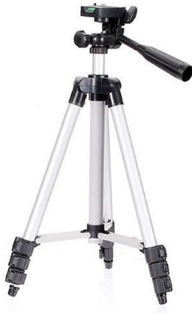
Ilustración 10- Trípode