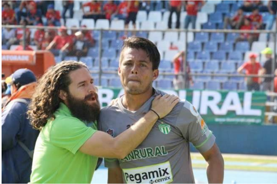
Ilustración 24– Antigua campeón

(Fuente: Fotografía propia - Estadio Doroteo Guamucho Flores)