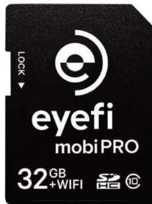
Ilustración 9– Tarjeta Wi-Fi