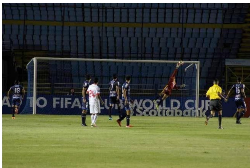
Ilustración 16- Gol

No existe un número determinado de fotografías que se deben entregar al medio, pero sí que sean fotos con excelente calidad. Es decir, fotografías enfocadas, no movidas y que transmitan emociones y que “hablen” por sí solas.