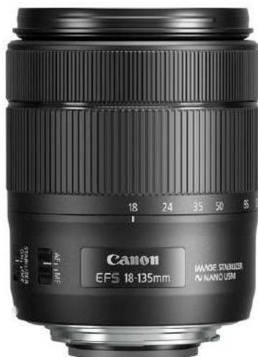
Ilustración 5– Lente 18-135mm