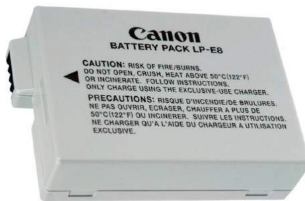
Ilustración 14– Batería extra