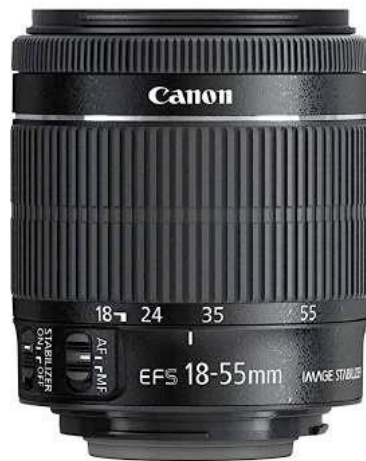
Ilustración 4– Lente 18-55mm