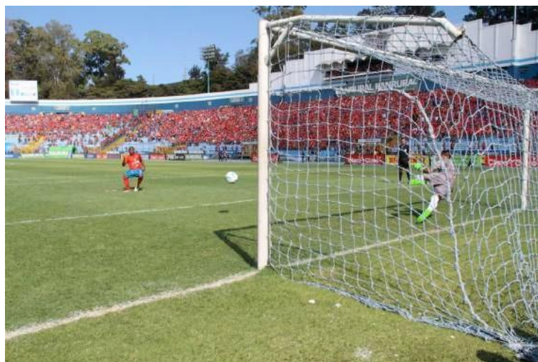
Ilustración 23– Penal