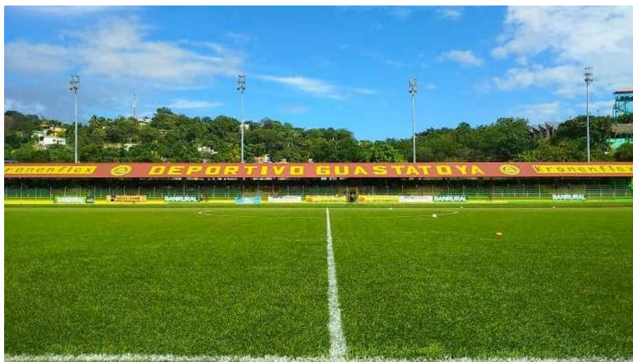
Ilustración 18– Guastatoya

Estas fotografías son las que se realizan en una cobertura multimedia, en los momentos previos, durante y después del partido de fútbol. Por lo general no se publican el mismo día del encuentro deportivo, pero sí se utilizan para posteriores publicaciones en las que se hace referencia a un equipo o a un jugador específico.