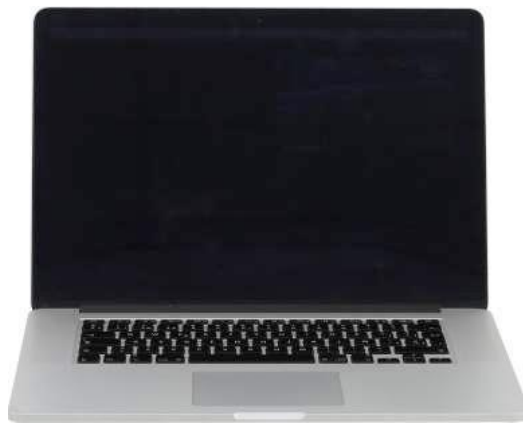
Ilustración 12– Computadora