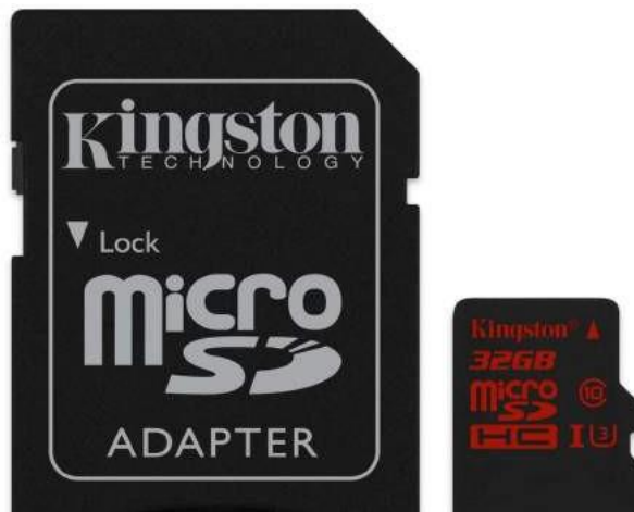
Ilustración 8 - Tarjeta micro SD

La clase se refiere a la velocidad de transmisión mínima que ofrece la unidad, no todas las tarjetas de memoria ofrecen la misma velocidad de transmisión, para elegir la mejor, se debe tomar en cuenta la tarea para la cual será utilizada y también el equipo en la cual se incorporará, la memoria clase 10 posee una transferencia de 10 megabytes por segundo (MB/s). Generalmente se llevan por lo menos dos memorias a la cobertura en el caso de que haya alguna falla. (Kingston Technology Corporation, 2018)