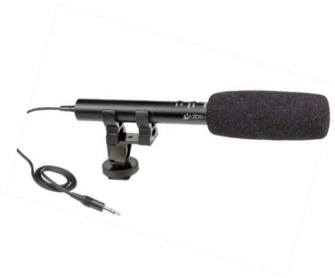
Ilustración 13– Micrófono