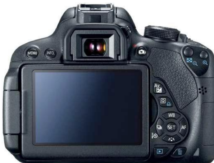
Ilustración 3- Cuerpo de cámara posterior