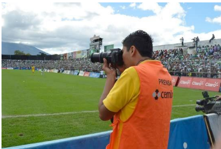
Ilustración 17– Chaleco

Toda vez iniciado el partido se deberá permanecer en el área posterior a las porterías en cada extremo del campo de fútbol y no se podrá mover de ella hasta que finalice la primera parte del encuentro. Así mismo, no se permite el paso por el área donde se encuentran los directores técnicos o la banca de ambos equipos.