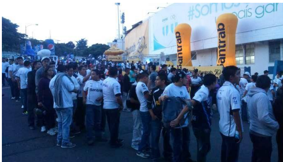
Ilustración 19– Afición cremat

(Fuente: fotografía propia – Estadio Doroteo Guamuche Flores)