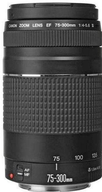
Ilustración 6– Lente 75-300mm