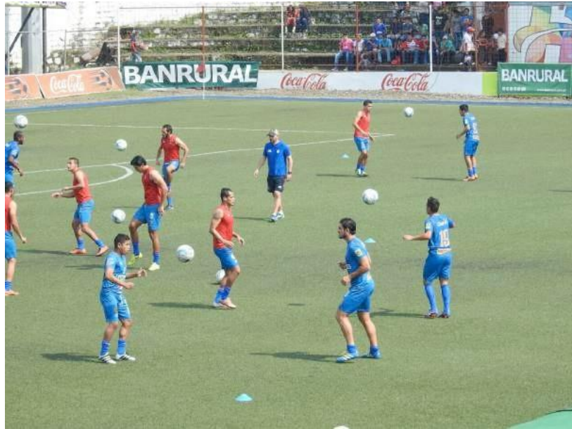
Ilustración 20– Calentamiento

Además de documentar a la afición, también se debe estar atento de la llegada al estadio de cada uno de los equipos y posterior a eso, el calentamiento que realizan en el terreno de juego en donde se encuentran los jugadores y la dirección técnica de cada equipo, además del equipo arbitral conformado por el árbitro principal y los asistentes.