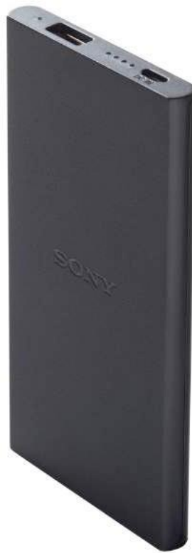
Ilustración 15– Batería de emergencia