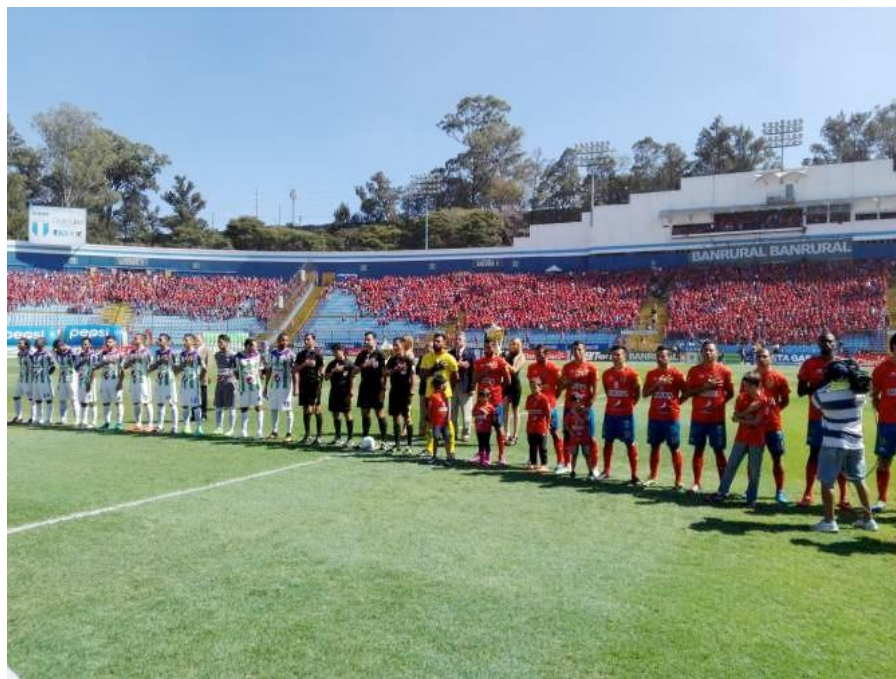
Ilustración 21– Previa

Posterior a esto se procede a tomar la foto oficial del equipo, el fotógrafo debe ser sumamente rápido, ya que dispone únicamente de segundos para lograrlo y por la cantidad de más colegas se vuelve un poco difícil conseguir el ángulo correcto.