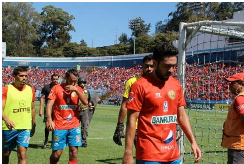
Ilustración 22– Final de partido