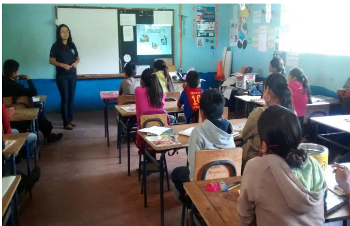
Tomada por: Ana Rocio Set. Año 2 014.