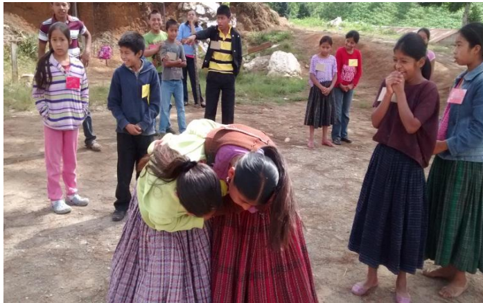
Año 2 014.