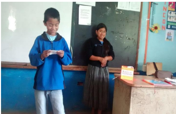
Año 2 014.