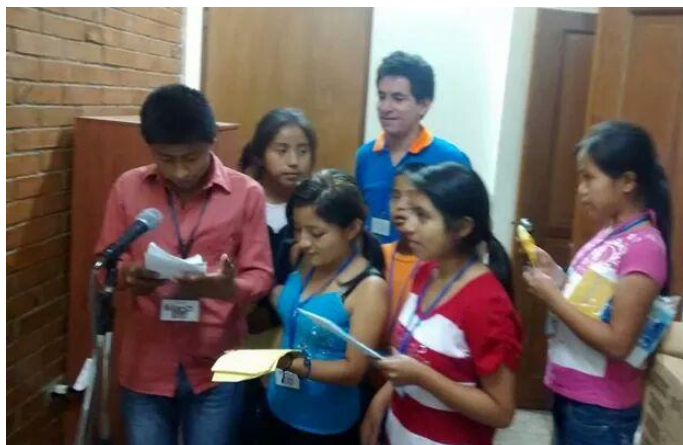
Año 2 014.

Al finalizar el proceso de formación y grabación, se hizo entrega de un diploma y reconocimientos a los 30 niños que los acredita como participantes y con la capacidad de desarrollar técnicas radiofónicas.