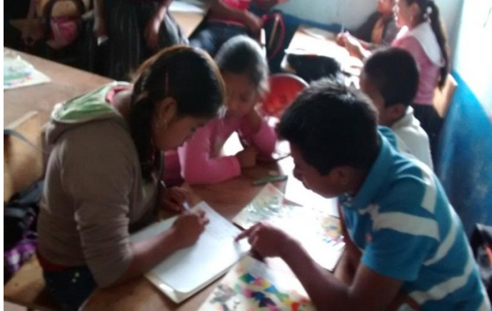
Año 2 014.