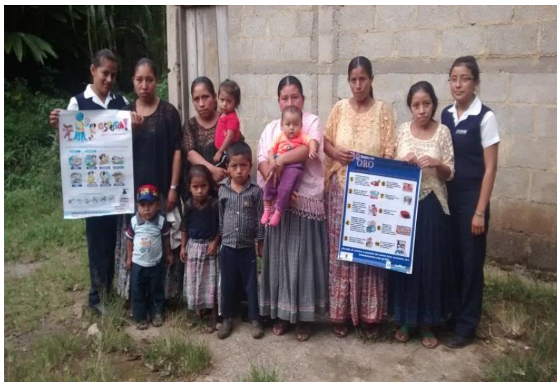
Año 2 014.