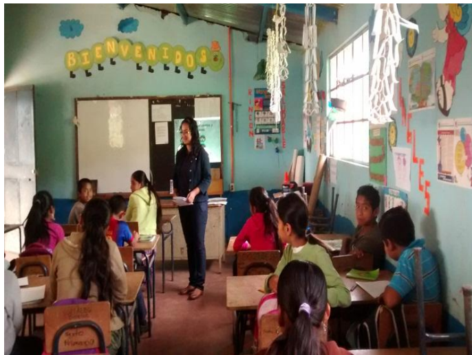
Año 2 014.