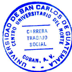
Lcda. Floricelda Chiquin Yoj Revisora de Redacción y Estilo