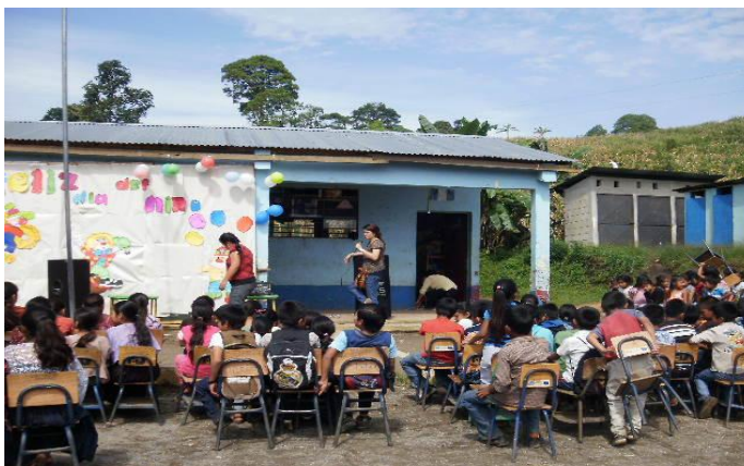
Tomada por: Bárbara Sierra. Año 2 014.