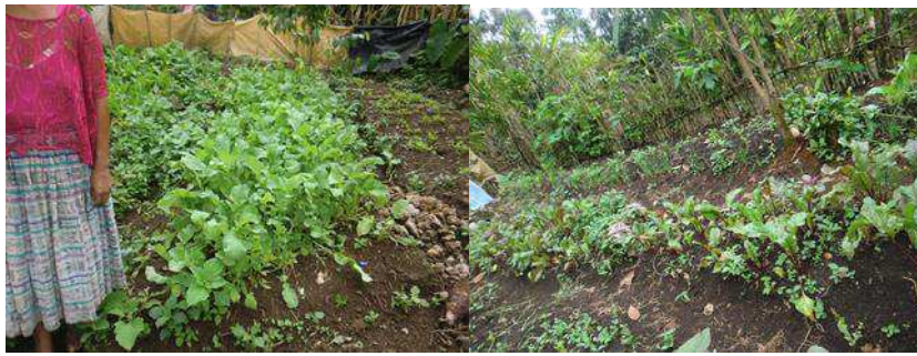
Año 2015.