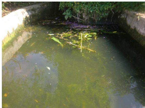
Año 2 015.