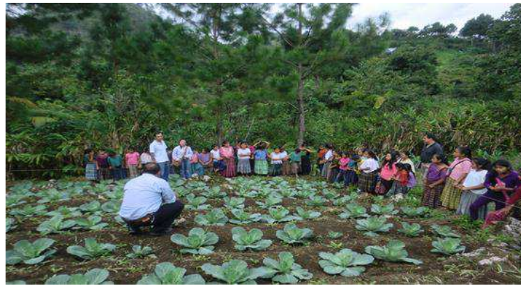
Año 2015.