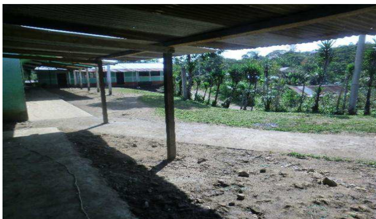
FOTOGRAFÍA 4 INSTALACIONES DE LA ESCUELA

Año 2 015.