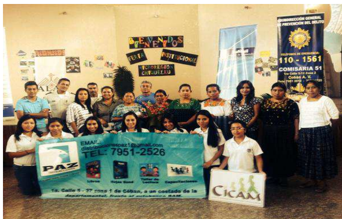
Año 2015.