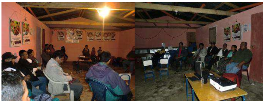
Año 2015.