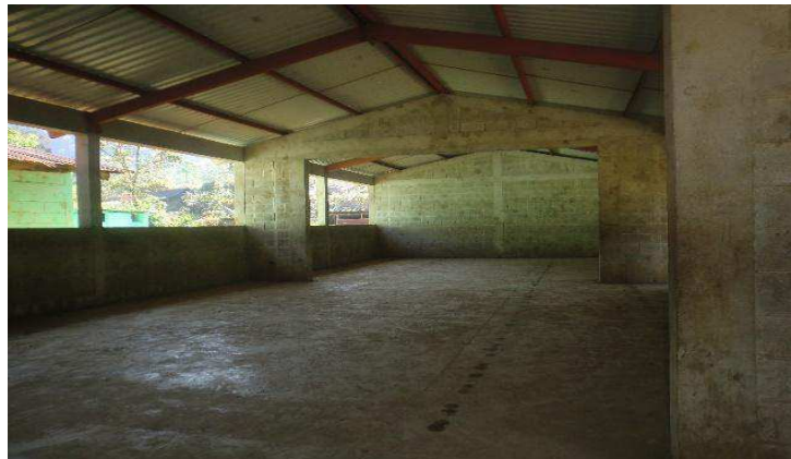
Año 2 015.

Las familias de la comunidad efectuaron la compra de un terreno para realizar un campo deportivo que beneficie al aprendizaje educativo de niños de la escuela y comunidad en general, con una aportación de Q100.00 por familia. Realizada la compra venta del terreno el Consejo Comunitario de Desarrollo (COCODE) solicita a la Municipalidad nivelar el área del campo; inician con el proceso en el año 2 013, y finalizan el 23 de mayo 2 015.