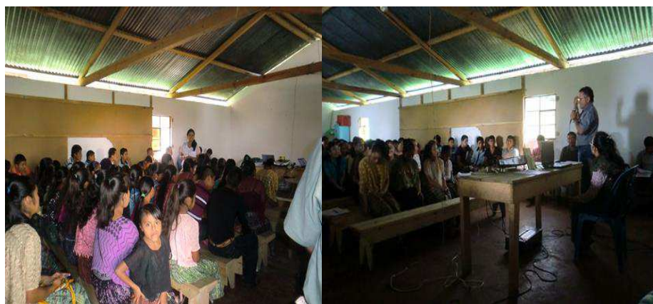
Año 2 015.