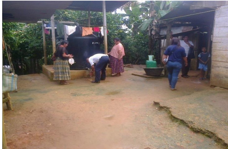
Año 2 015.