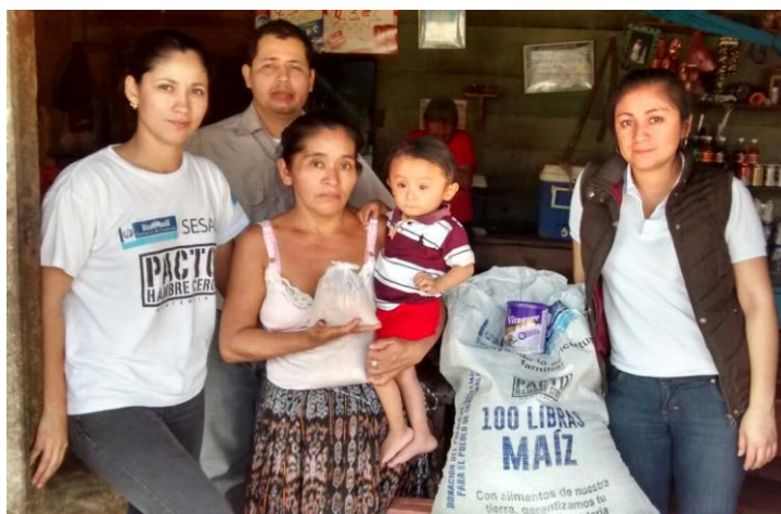
Año 2 015