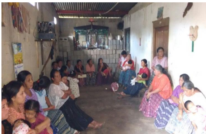
Año 2 015.