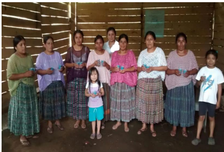
Tomado Por: Madre guía de la comunidad. Año.2015.

d. Elaboración de candelas y veladoras: coordinado y con apoyo de la Secretaria de Obras Sociales de la Esposa del Presidente (SOSEP) aportó los materiales que se utilizaron.