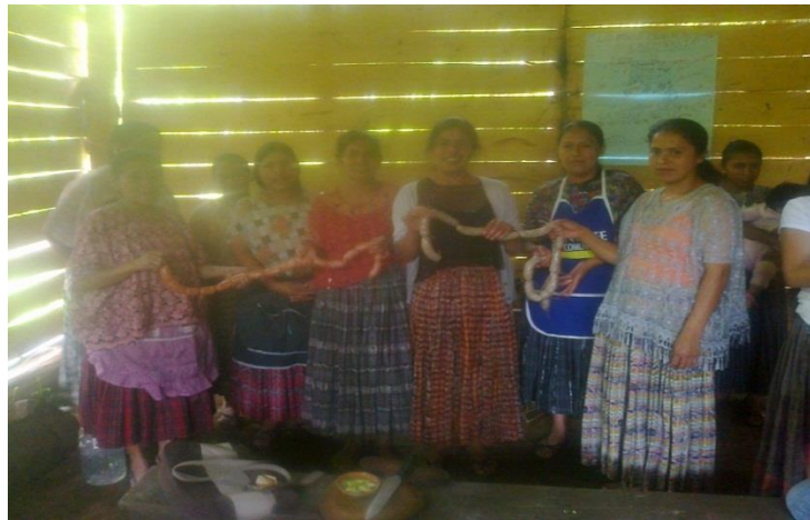
Año 2 015.

c. Elaboración de jabón: en esta actividad se contó con el apoyo de la Secretaria de Obras Sociales de la Esposa del Presidente (SOSEP), la cual aportó cada uno de los materiales a utilizar. Todas las señoras que asistieron en la actividad participaron en la elaboración de la mezcla de los insumos para realizar el jabón, explicándoles paso a paso la forma de elaborarlo.