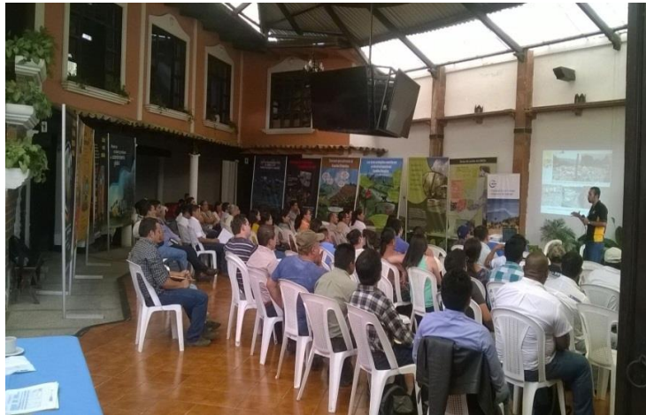
Año 2 015.