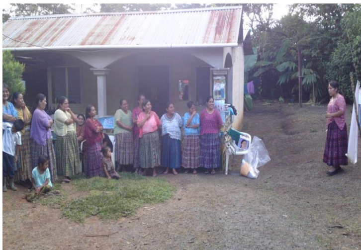
Año 2 015.