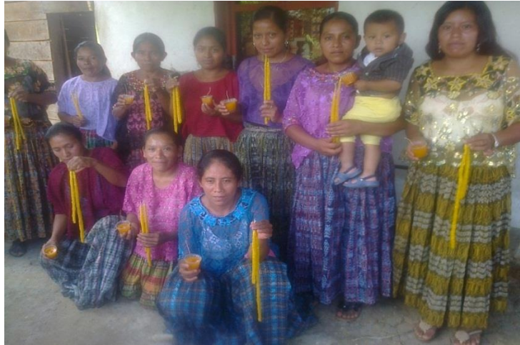
Año 2015.