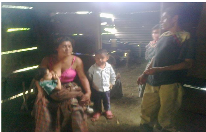
Año 2 015.