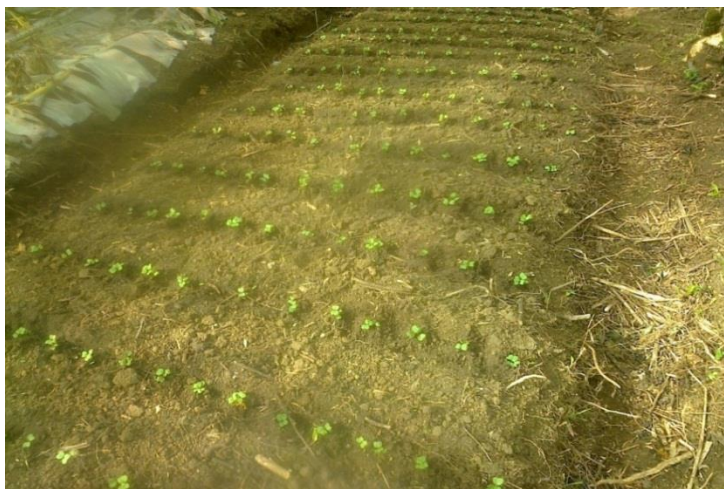
Año 2 015.