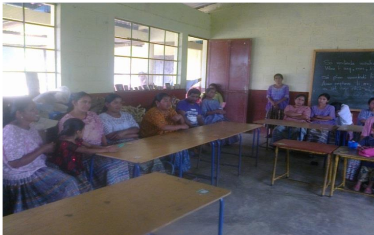
Año 2 015.

Durante el desarrollo de cada uno de los diferentes módulos se utilizó el método aprender haciendo, donde los participantes que asistieron en cada una de las actividades se involucraron y opinaron conforme se desarrollaron las capacitaciones.