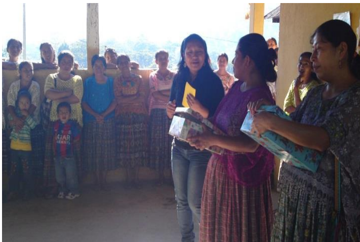
Año 2 015.