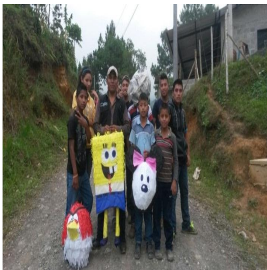
Año 2015