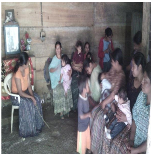
Año 2015