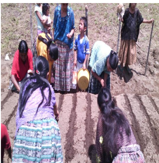
Año 2015