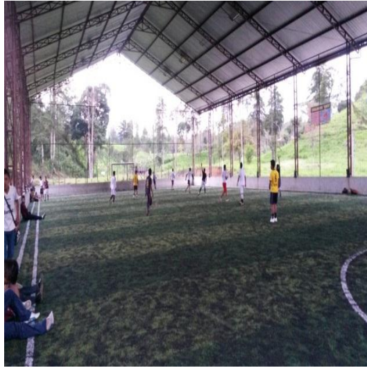
Tomada por: Sucely Ramírez. Año 2015