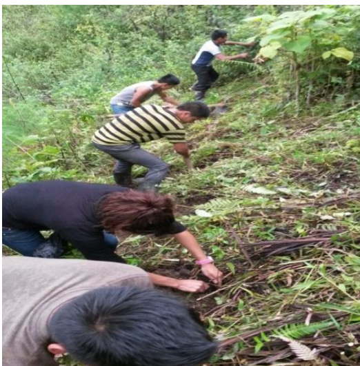
Año 2015