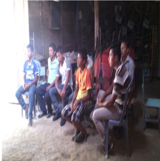
Año 2015