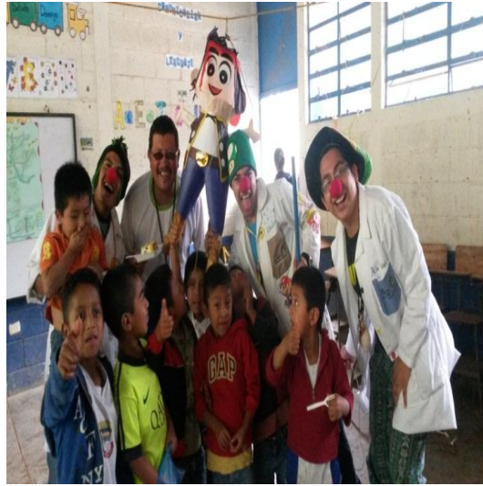
Año 2015