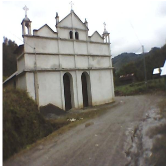
Año 2015