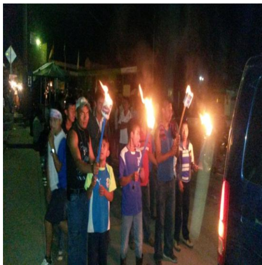
Año 2015