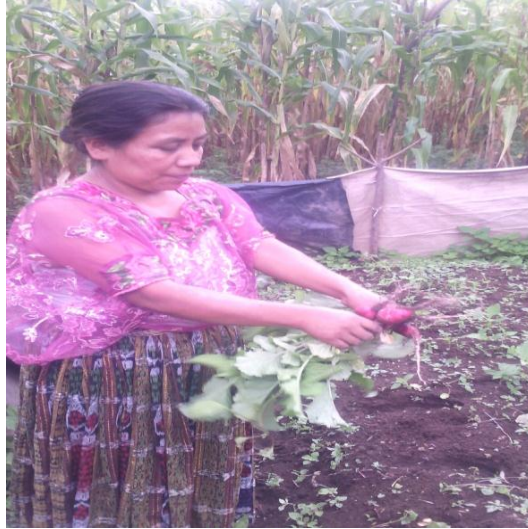
Año 2015