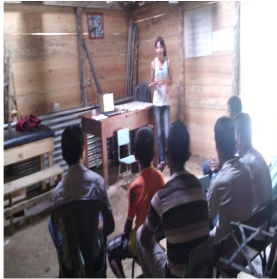
Tomada por: Gustavo Granados. Año 2015.