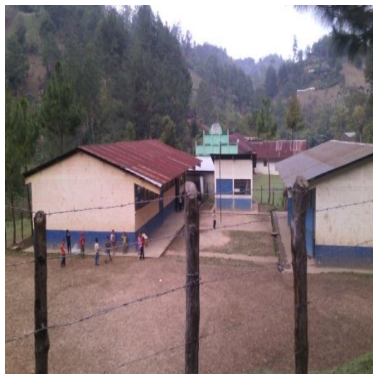
Año 2015

La antigua escuela es utilizada como salón comunal, 2 iglesias evangélicas y 1 católica, 3 molinos de nixtamal, 7 tiendas distribuidas en los 4 sectores de la comunidad.