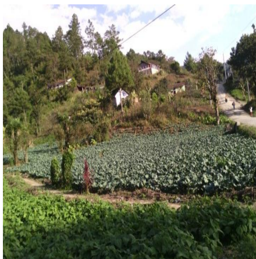
Tomada por: Sucely Ramírez. Año 2015.