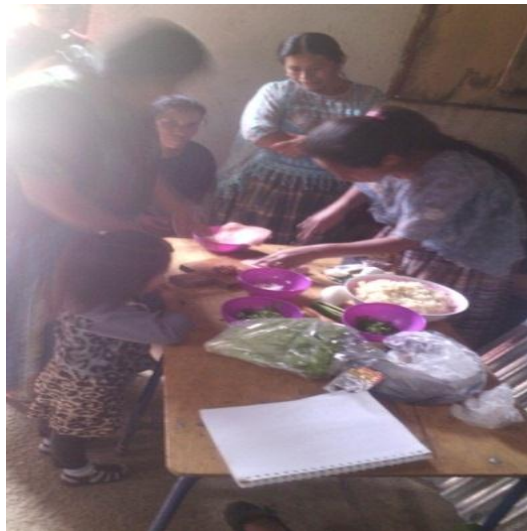
Año 2015