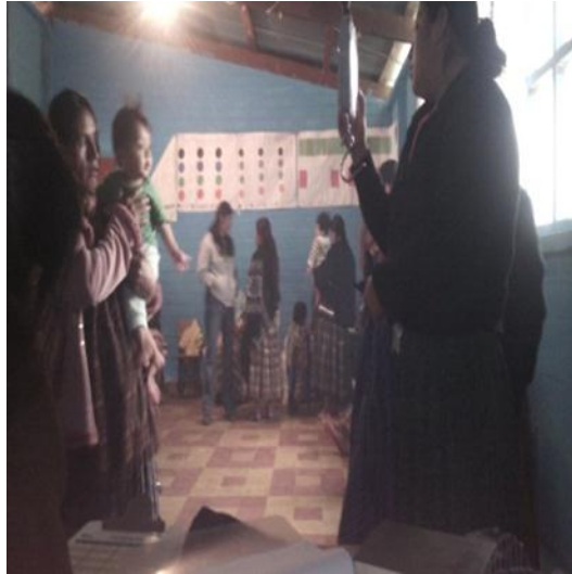
Año 2015