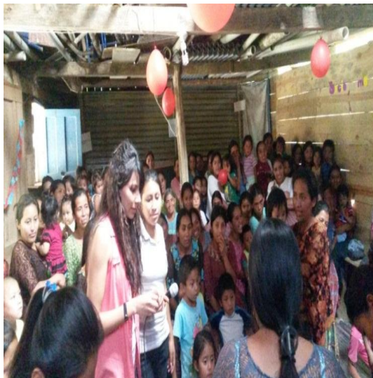
Año 2015