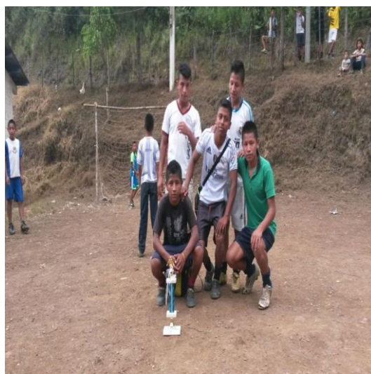
Año 2015