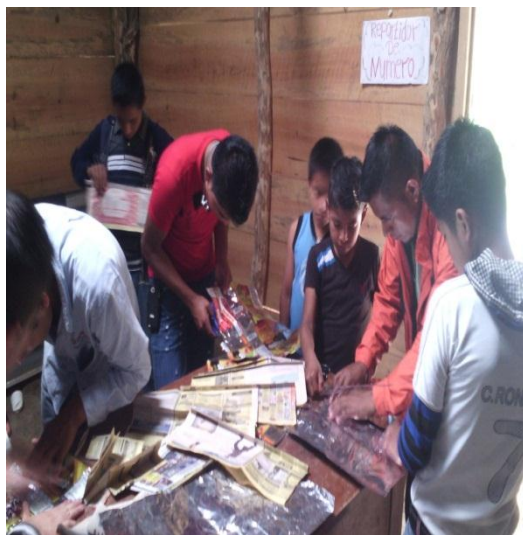
Año 2015