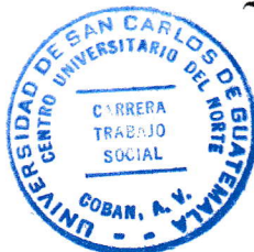
Lcda. Floricelda Chiquin Yoj Revisora de Redacción y Estilo