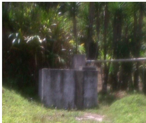
Tomada por: Emily Andrea Zuleta Ax. Año 2 014.

La recolección del vital líquido la hacen a través de piletas de block y cemento ubicadas en diferentes viviendas,