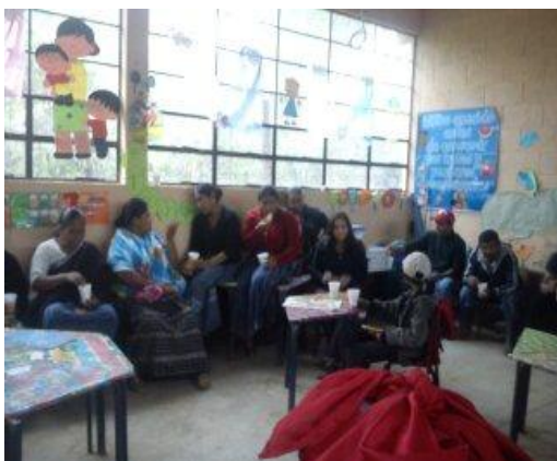
Tomada por: Emily Andrea Zuleta Ax. Año 2 014.