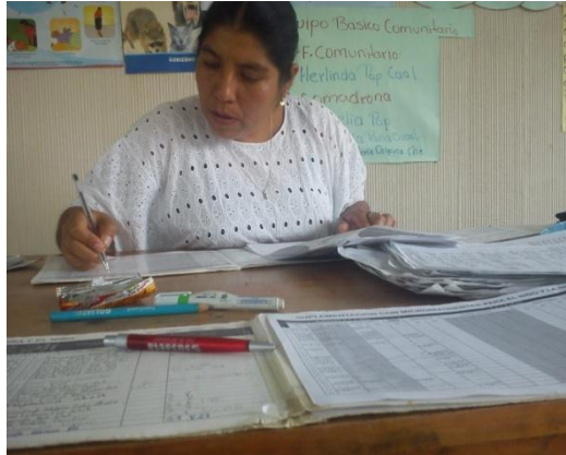
Tomada por: Emily Andrea Zuleta Ax. Año 2 014.