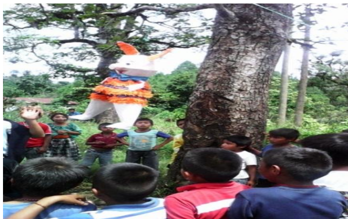
Año 2 014.