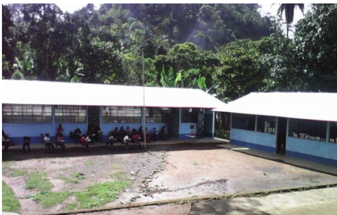
FOTOGRAFÍA 4 ESCUELA OFICIAL MIXTA CASERÍO CHISEB SEPOC