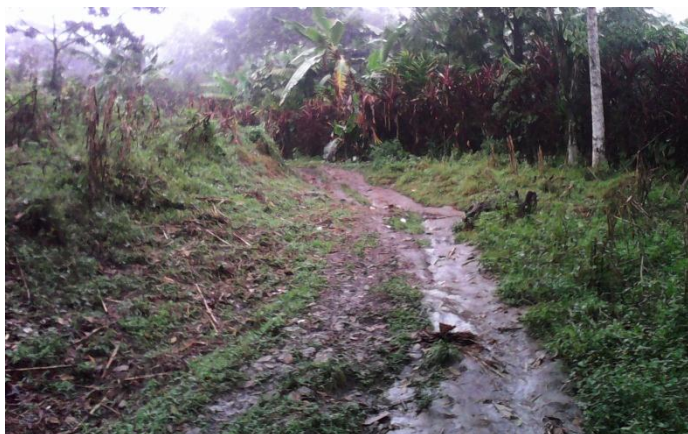
Año 2 014.