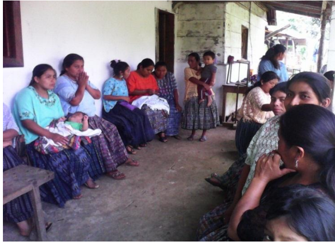
Año 2 014.