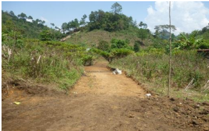
Año 2 014.