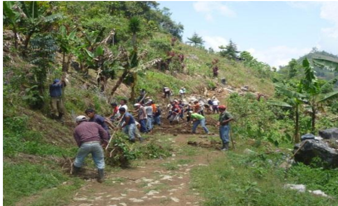
Año 2 014.