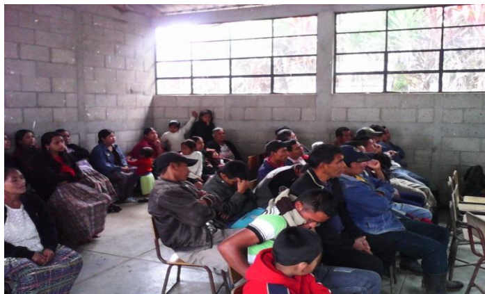
Año 2 014.