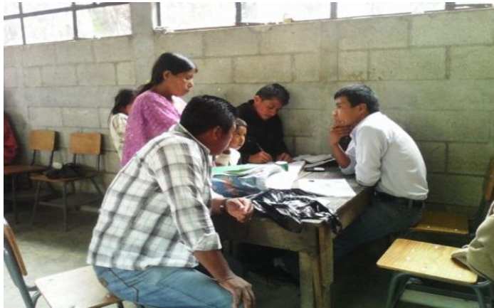
Año 2 014.