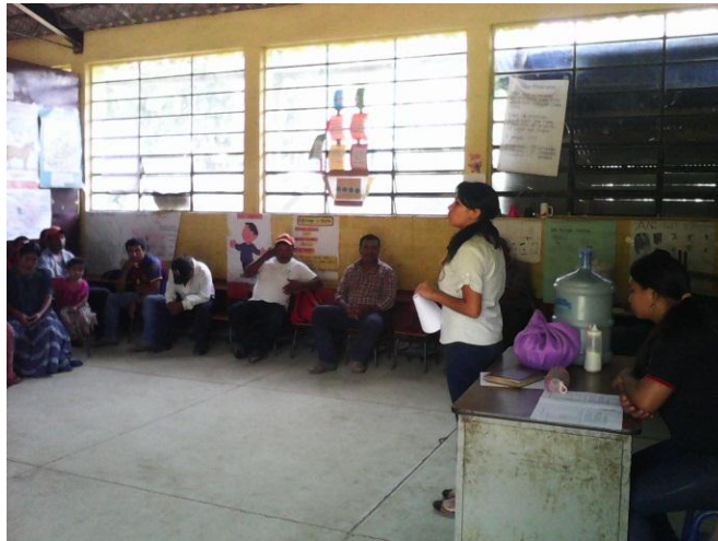
Año 2 014.