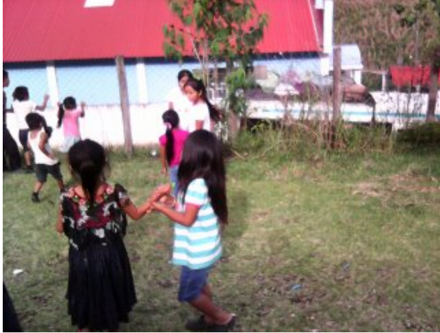
Tomada por: Delia Pacay, Año 2016.