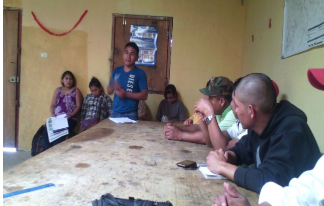
Año 2016.