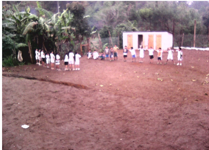
Tomada por: Delia Pacay, Año 2016.