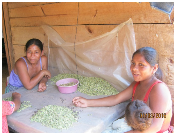
Año 2 016.

Los varones al no encontrar fuentes de empleo en su propia comunidad, optan por trabajar como agentes de seguridad, estos se trasladan a otros municipios en donde puedan desempeñar un empleo, o realizar trabajos por día con vecinos en la misma comunidad para obtener un ingreso diario promedio de Q. 40.00.