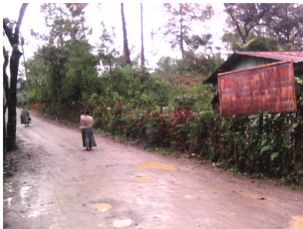
Tomada por: Delia Pacay, Año 2016.