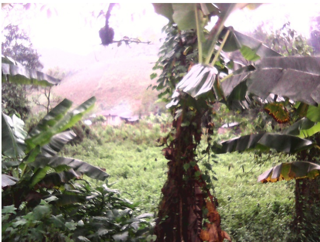
Tomada por: Delia Pacay, Año 2016.