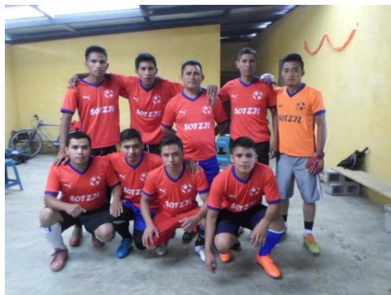
FOTOGRAFÍA 14 EQUIPO DE FUTBOL ALDEA SOTZIL

Así también se movilizó recursos en algunas empresas y personas particulares para obtener agua pura, pelotas, camisolas deportivas, trofeos y demás requerimientos para este tipo de actividades, los encuentros deportivos se realizaron bajo las normas adecuadas que permitan una convivencia pacífica y de respeto entre los equipos. Al final fueron premiados los equipos ganadores.