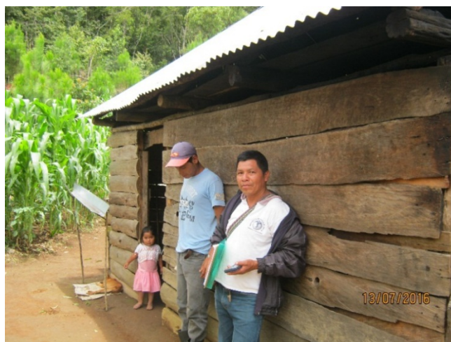
Año 2016.