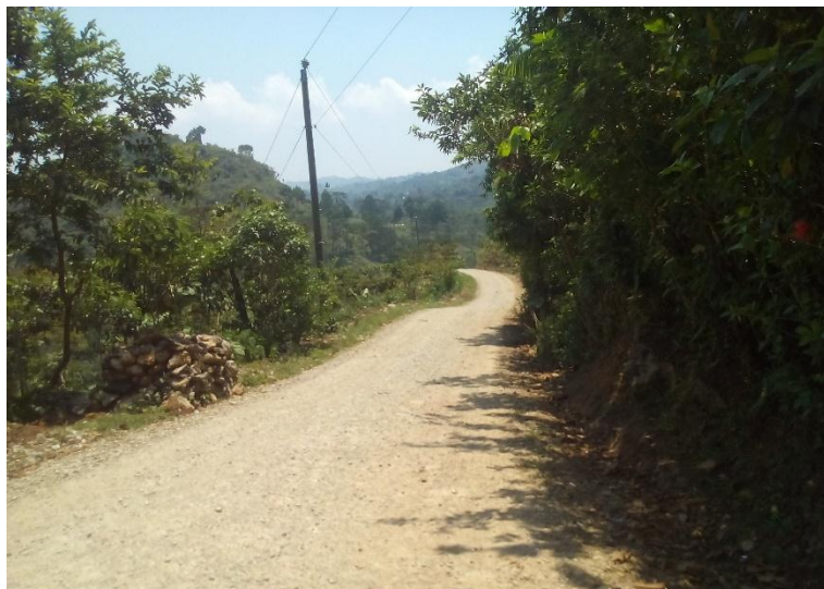
Año 2016.