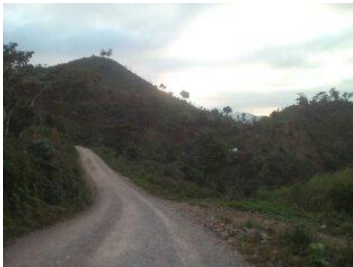
Año 2016.