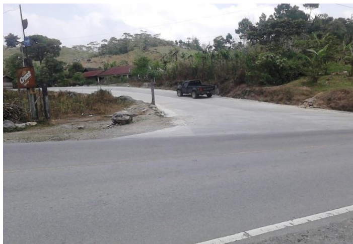
Año 2 013.