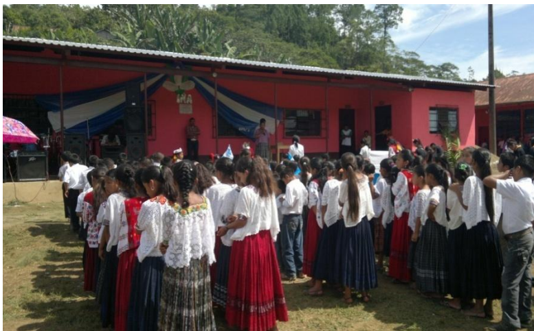
Año 2 013.