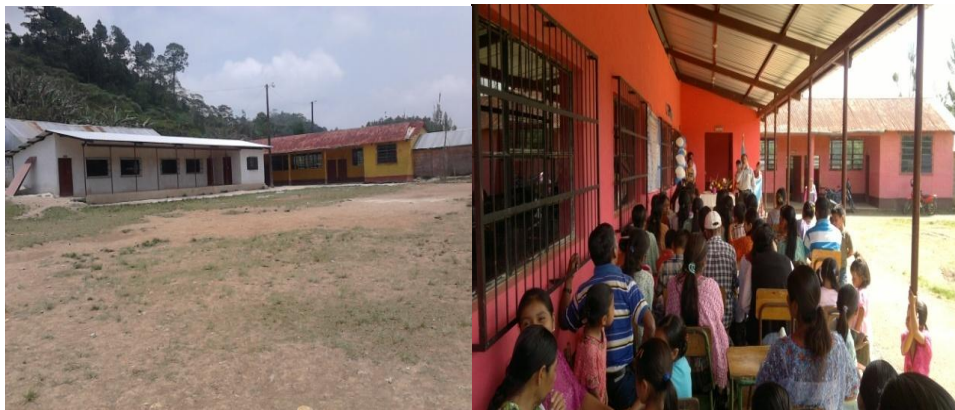
Año 2 013