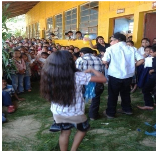
Año 2 013