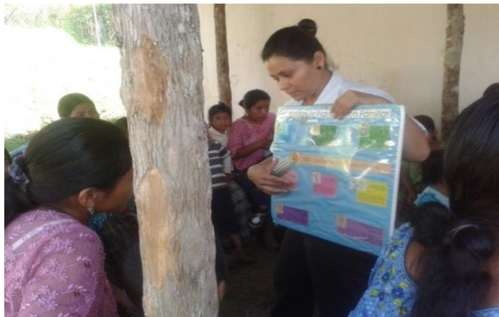
Año 2 013.