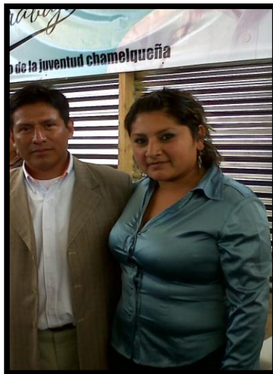
Año 2 013.