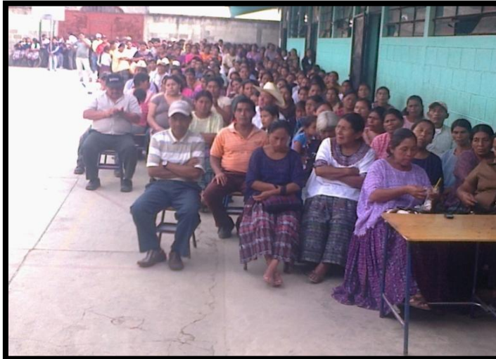
Año 2 013.