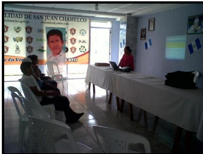
Año 2 013.