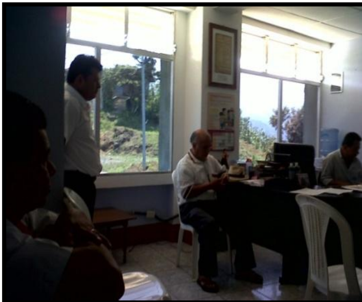
Año 2 013.