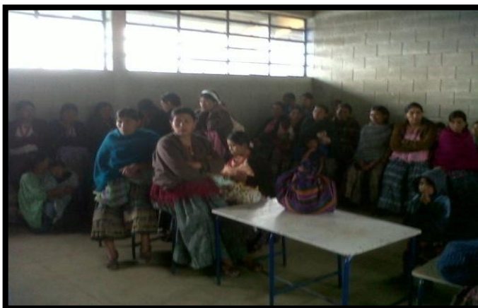
Año 2 013.