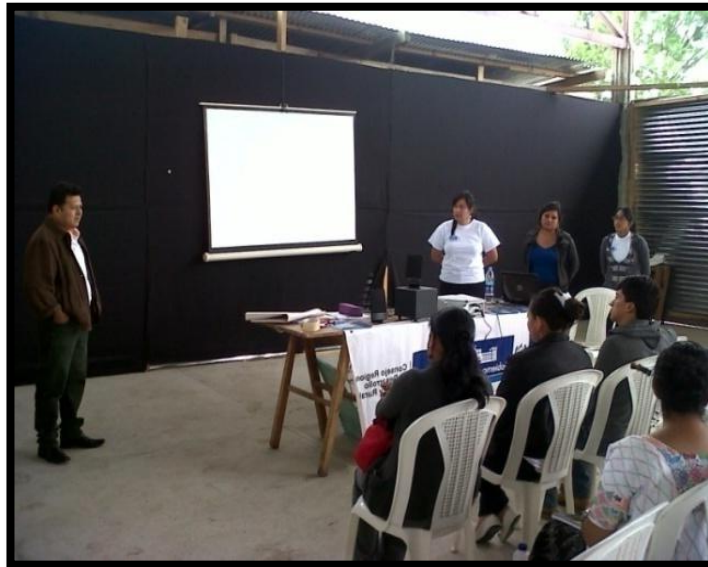
Año 2 013.