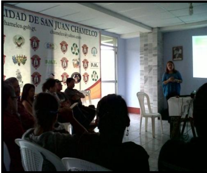
Año 2 013.