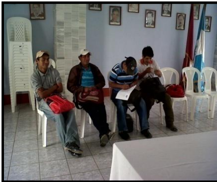
Tomada por: Evelyn Barrios. Año 2 013.