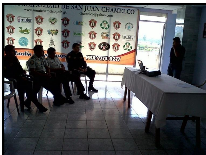
Año 2 013.