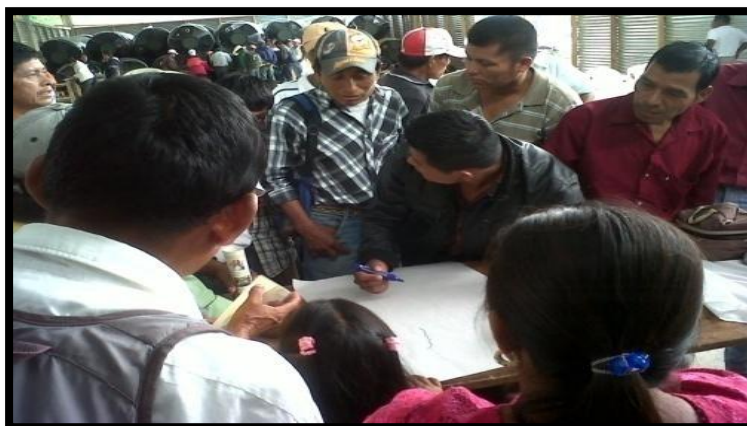
Año 2 013.