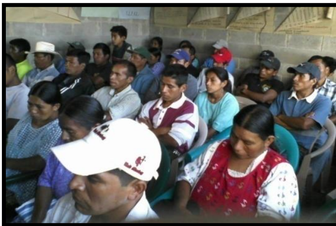
Año 2 013.