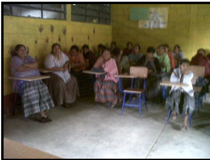
Año 2 013.