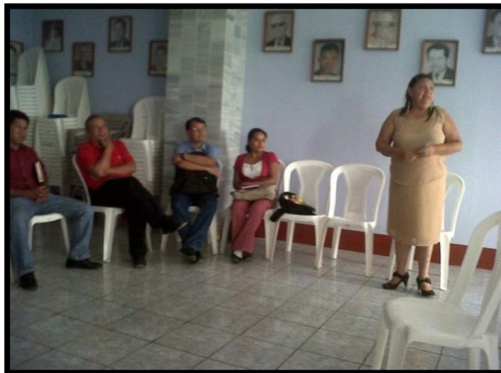
Año 2 013.