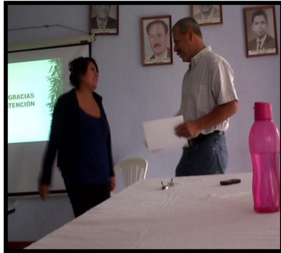
Año 2 013.