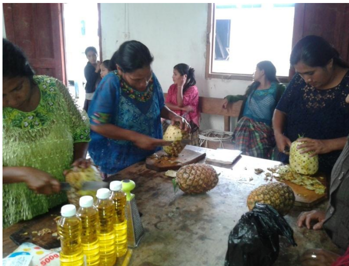
Año 2 014.