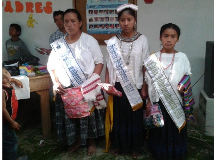
Año 2 104.