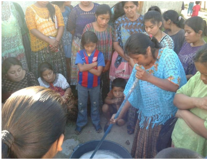
Año 2 014.