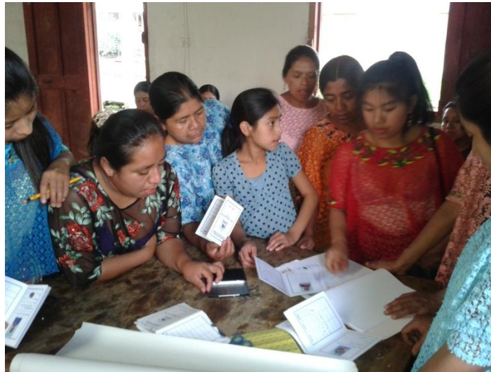
Año 2 014.