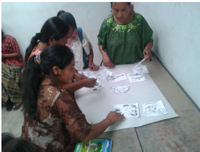
Año 2 014.