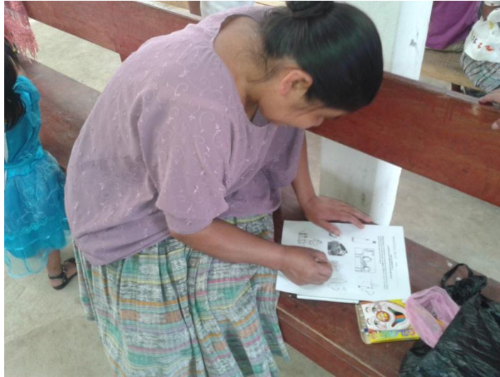
Año 2 014.