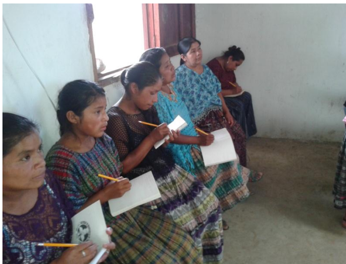
Año 2 014.