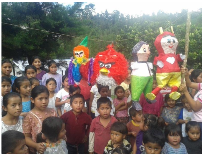
Año 2014.