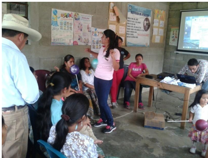
Tomada por: Rosa Lima. Año 2014.

La segunda sesión, se llevó a cabo en el salón de usos múltiples de la comunidad de Santa Cecilia Chajaneb, se tuvo como participantes a las señoras de las aldeas: Cojila y Santo Tomas Chajaneb. En esta ocasión no se contó con la participación de la SESAN, debido a la falta de compromiso de los representantes institucionales. En consecuencia las estudiantes de trabajo social fueron las encargadas de ejecutar las actividades planificadas, abordando la misma temática: desnutrición crónica y aguda. Para el desarrollo se efectuó una presentación en diapositivas y explicación dialogada. De igual manera se efectuaron dinámicas para evaluar los aprendizajes y tener certeza que los mensajes han sido centrados y el