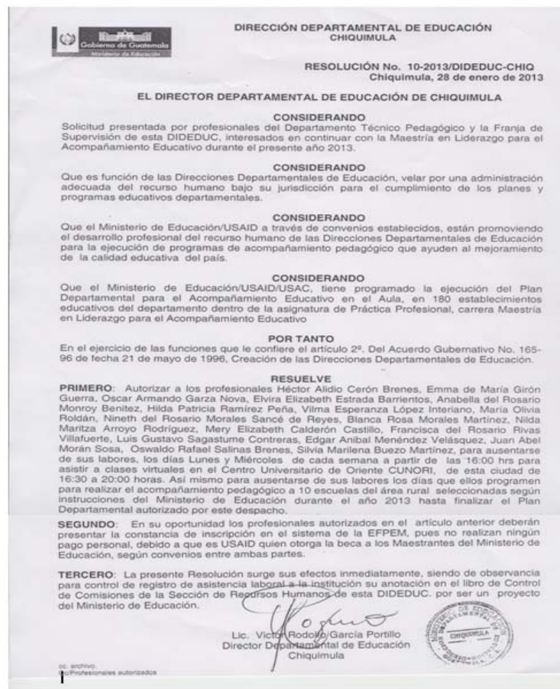
Figura No.1 Resolución No.10-2013 emitida por el Director Departamental de Educación de Chiquimula, para otorgar el permiso correspondiente para el Acompañamiento Pedagógico.