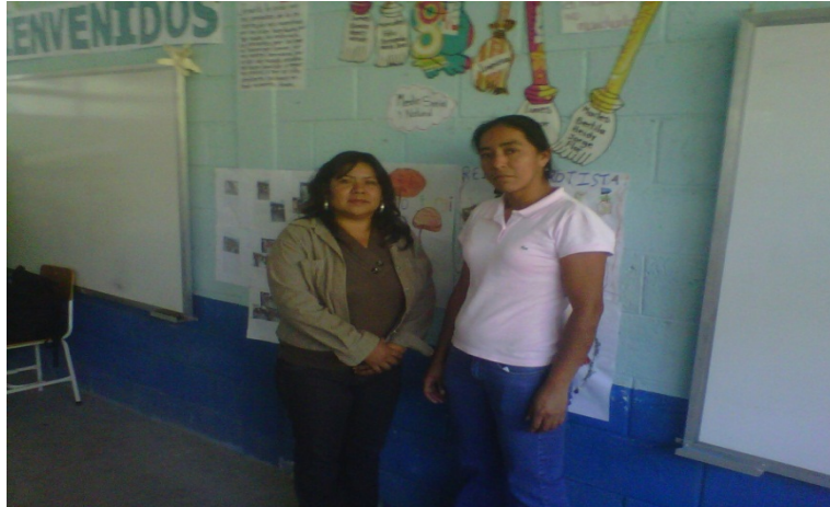
Imagen No.3 Acompañante Pedagógicos y Docente de Primer grado de la EORM Caserío Rincón del Burro Aldea La Peña, Quezaltepeque, Chiquimula.