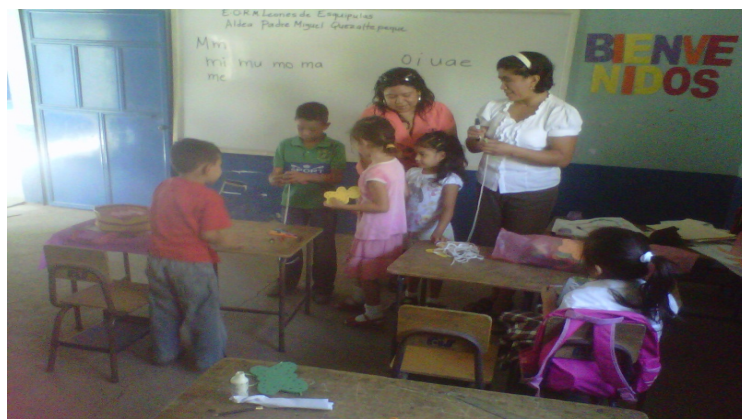
Imagen No.4 Acompañante Pedagógicos y Docente de Primer grado de la EORM Leones de Esquipulas, aldea Padre Miguel Burro Quezaltepeque, Chiquimula.