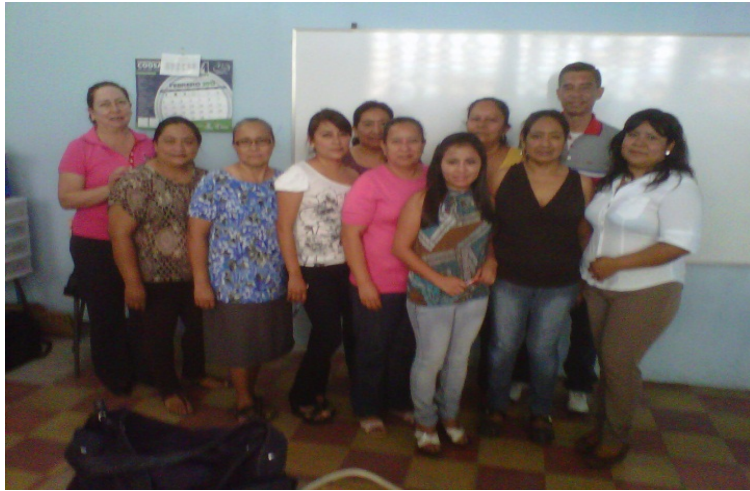
Imagen No.1 Acompañante Pedagógico y los Diez Directores (as) de las Escuelas seleccionadas del municipio de Quezaltepeque del Departamento de Chiquimula.