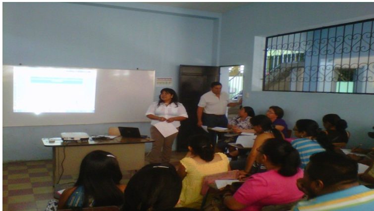
Imagen No.2 Acompañante Pedagógicos y Directores en la Socialización del Plan Departamental de Acompañamiento.