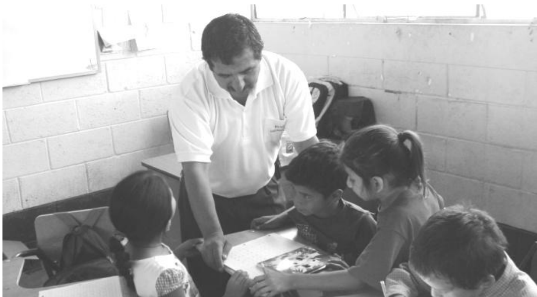
Alumnos y alumnas, en grupo comparten diferentes formas de escribir los números.