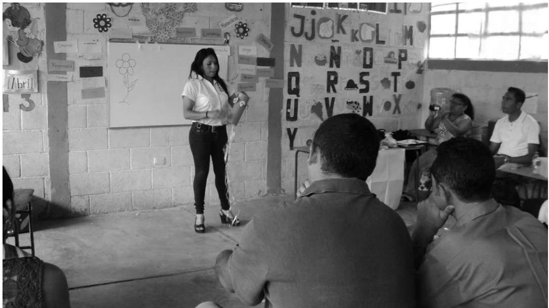
Fotografía 6. Sesión de comunidad de aprendizaje, EORM, Barrio La Libertad, Área Marginal, Monjas, Jalapa. 26-04-2013.