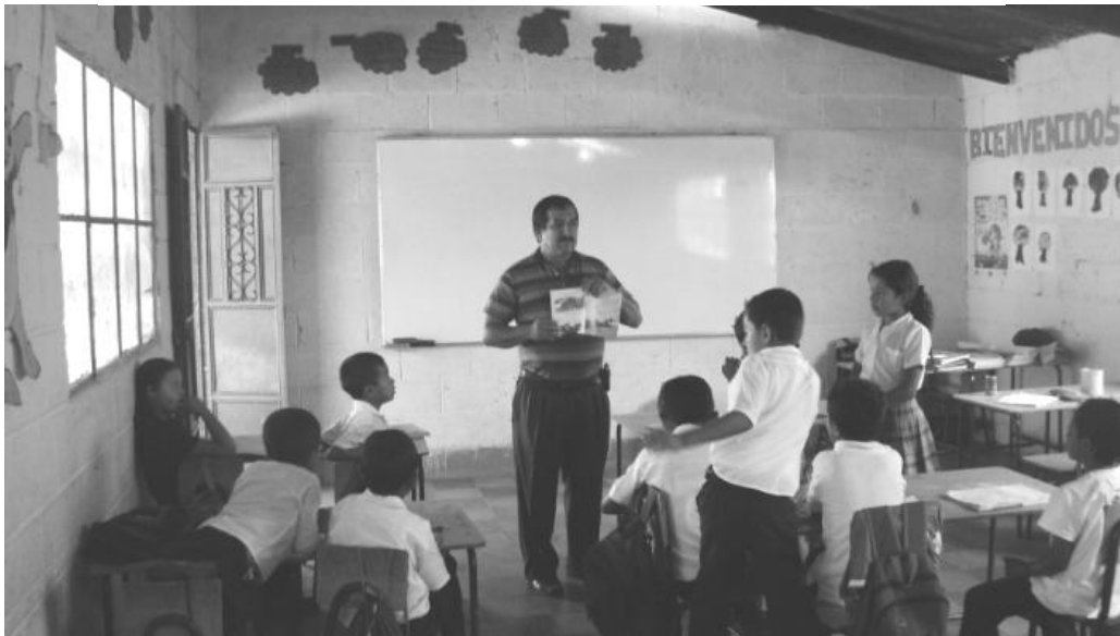
A.P. desarrolla una clase, utilizando el aprendizaje significativo.