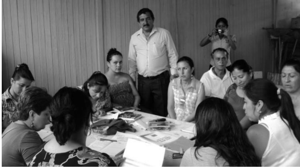
Fotografía 5. Capacitación sobre Proyecto Educativo Institucional, San Luis Jilotepeque, Jalapa.