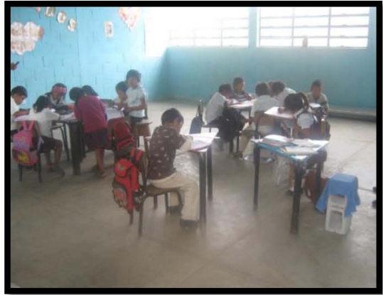
Visita EORM Barrio la Estrella