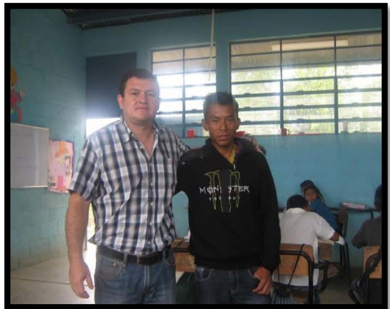
EORM Barrio la Loma