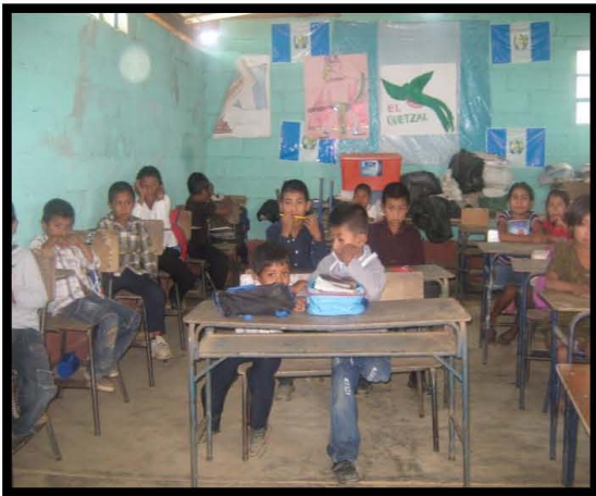
EORM Aldea El Pinalon