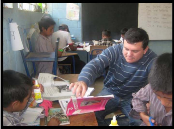
Visita EORM Caserío los Dos Cruces