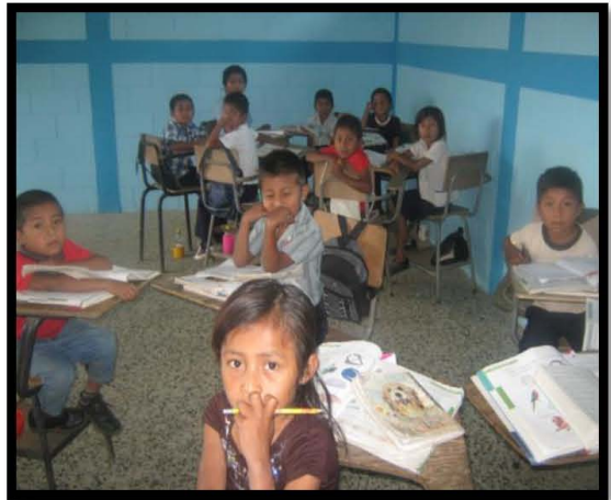
EORM Barrio el Chucte