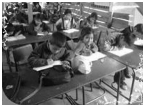
Imagen No. 3

Alumnos EORM Aldea La Laguna, Jalapa Ubicados en filas, elaborando muestras en sus cuadernos