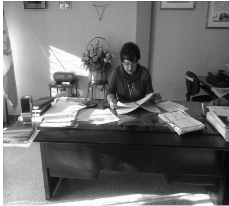
Imagen No. 1 Directora Departamental de Educación, Jalapa analiza Plan Departamental de Mejoramiento Educativo y emite Oficio de Autorización para su implementación