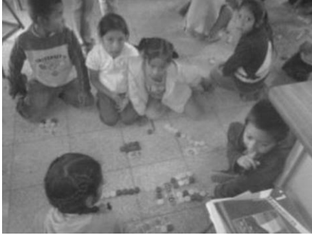
Imagen No. 5

Alumnos de EORM Caserío el Pajalito, Aldea El Pajal, Mataquescuintla, Jalapa, desarrollando actividades lúdicas en el área de matemática con material concreto