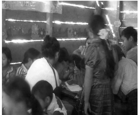
docente orienta a una alumna,