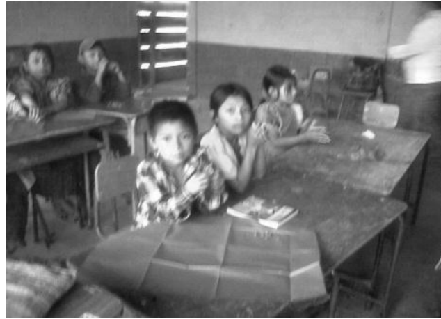
Los alumnos en aprestamiento, Cumbre de la Arada