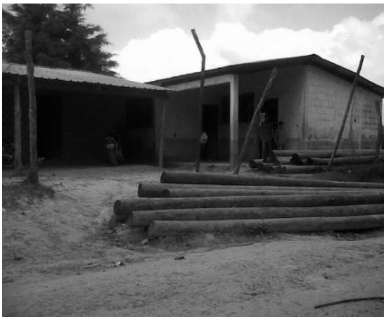
El Rodeo, estado de la escuela bilingüe