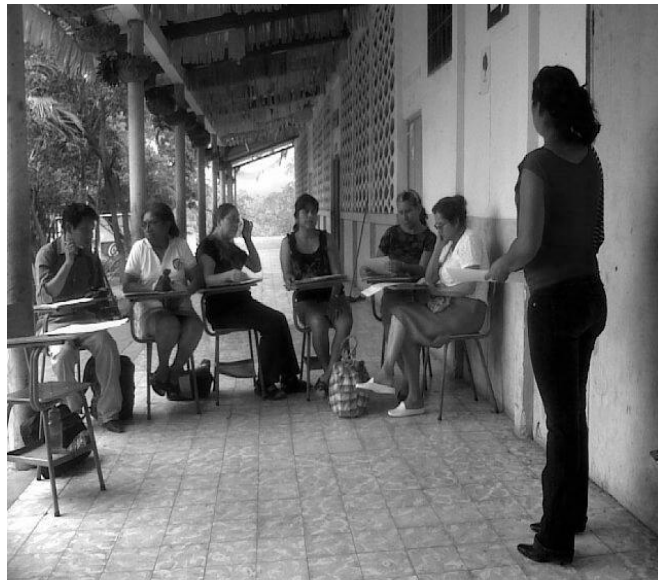
Conformando la Comunidad de aprendizaje en la Escuela de Varones