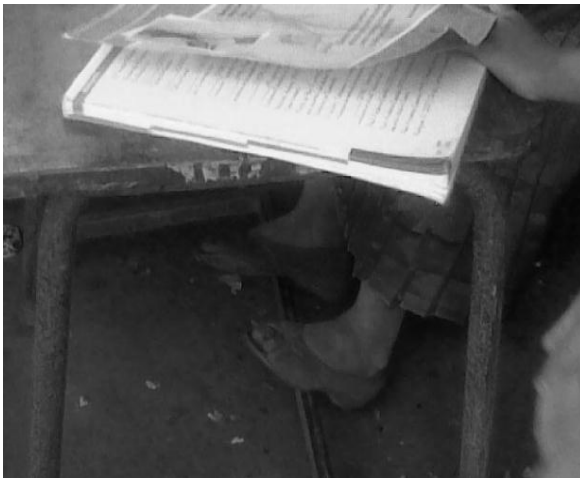
Pisos de tierra, Tatutú Tatutú