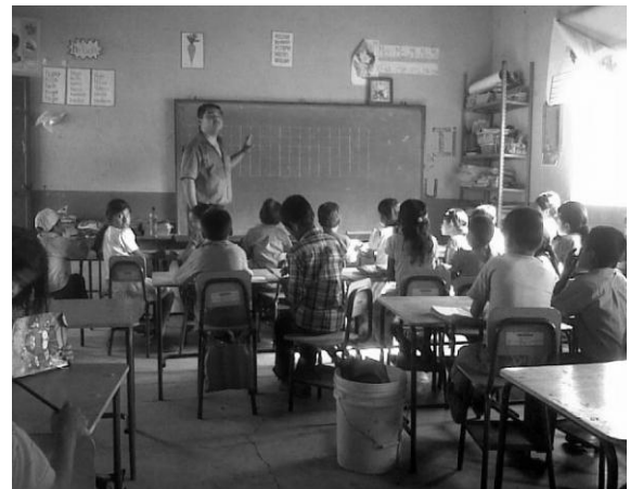
Guareruche, docente en la enseñanza