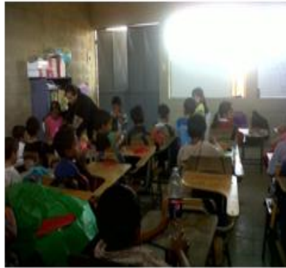
La docente trabajando en la primera Visita.