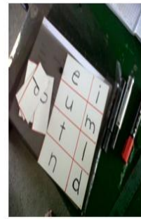
Acuerdos de la visita anterior que hoy se observan como el rayado del pizarrón. Las tarjetas de 10X5 para escribir las letras del abecedario. EORM aldea Belén