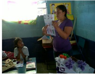
Una de las docentes acompañadas de la EORM aldea Belén