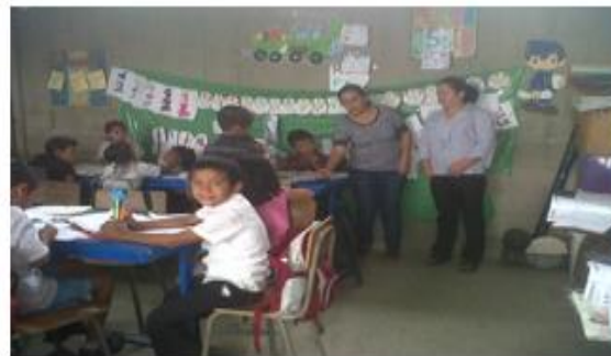
La docente con su aula organizada en grupos de estudiantes