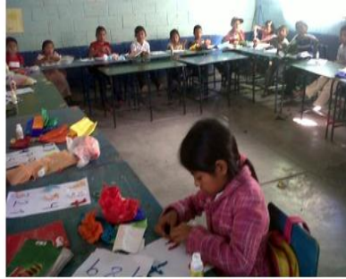
Alumnos de la EORM aldea Belén trabajando, en la segunda visita.