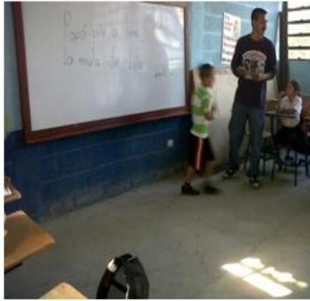
Docente antes del acompañamiento