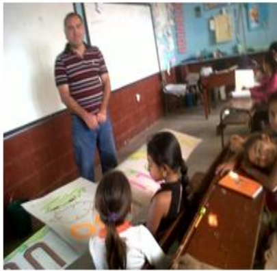
Docente dando su clase al principio antes del Acompañamiento