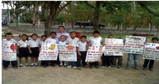
Docentes de la EORM aldea Atulapa, evidenciando sus logros alcanzados