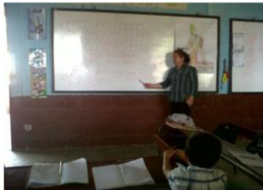
AP evaluando los aprendizajes de los estudiantes con dificultad de aprender