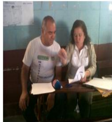
AP modelando una técnica para la enseñanza de una letra