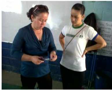
AP modelando una técnica enseñanza a la docente de la sección B de la EORM aldea Belén