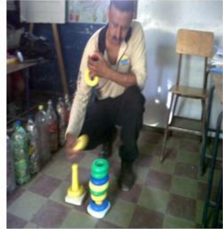
docente realizando modelaje de juegos para la enseñanza de la matemática