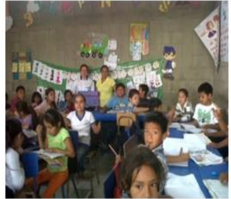
La nueva docente mostrando el portafolio