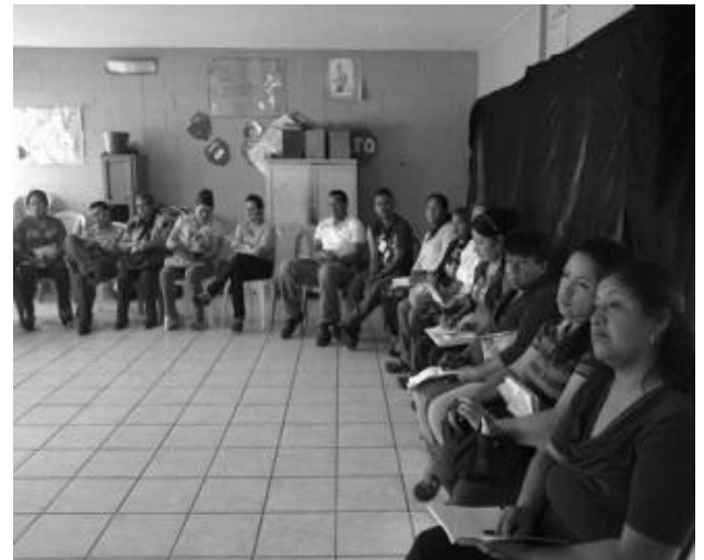
Foto # 4

Fuente: EORM Cas. Ixpacagua, aldea las Brisas, Mataquesuintla Aprendizaje Significativo