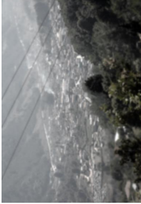
Foto 1. Vista panorámica de la cabecera Municipal de Todos Santos Cuchumatán, Huehuetenango