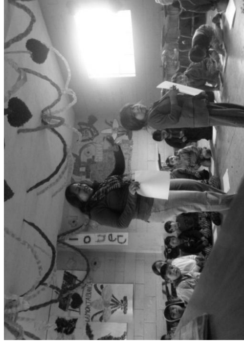
Foto 4. Desarrollo de Modelaje de actividad desarrollada por secuencias de Aprendizaje en el aula de Primer grado de la EORM caserío Tzurul, Aldea Chicoy.