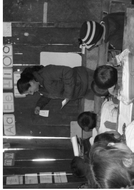
Foto 3. Desarrollo de Modelaje de actividad por Secuencia de Aprendizajes en el aula de Primer grado de la EORM cantón Nueva Comunidad