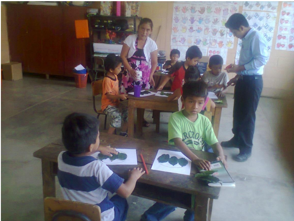
Anexo No. 6. EORM. Santo Domingo I. Utilizo Recursos del Contexto.