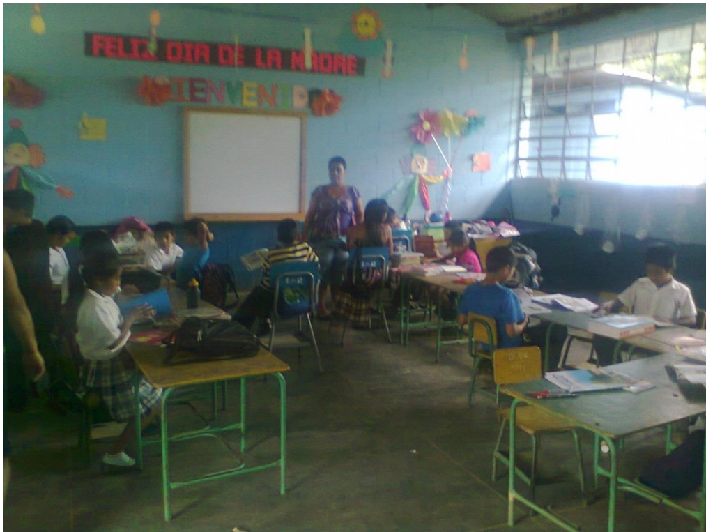
Anexo 2. EORM. Caserío El Naranjal. Actividad Comprendo lo que leo.