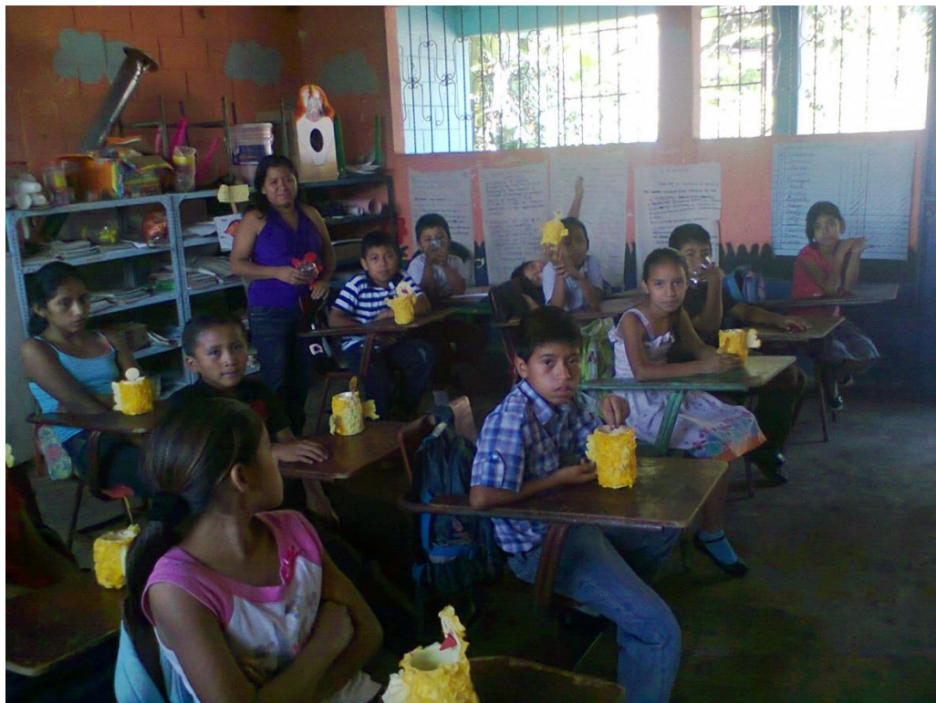
Anexo 10. EORM La Joyita. Desarrollo de destrezas.