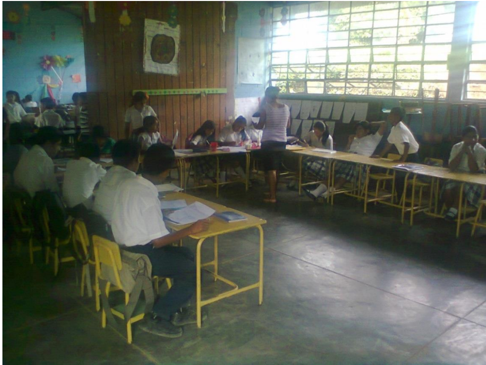
Anexo No. 1 EORM. La Joya. Estrategias de Comprensión lectora.