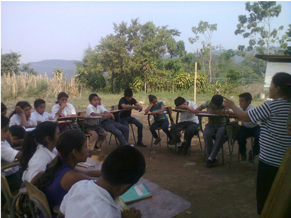
Anexo No. 8. EORM. La Joya. Compartimos Anécdotas.