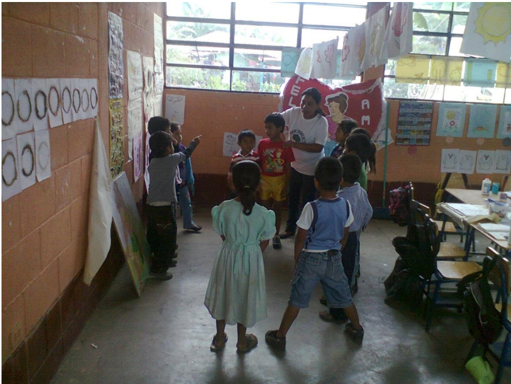
Anexo No. 4. EORM. Sector La Piedrona. Jugando Aprendo.