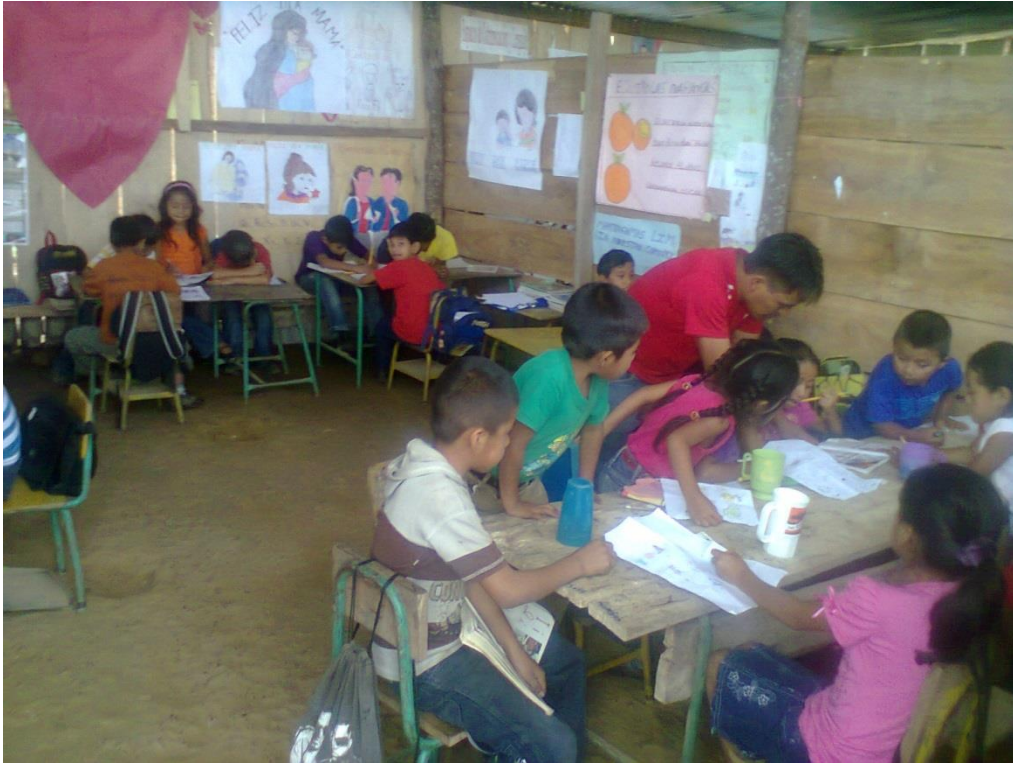
Anexo No. 5.EORM. Zelandia. Trabajo en Equipo.