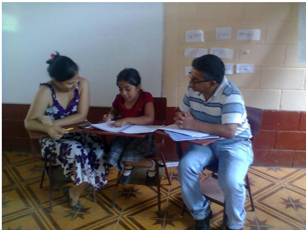
Anexo No. 11. EORM. La Joyita. Evaluación Basada en el Currículum