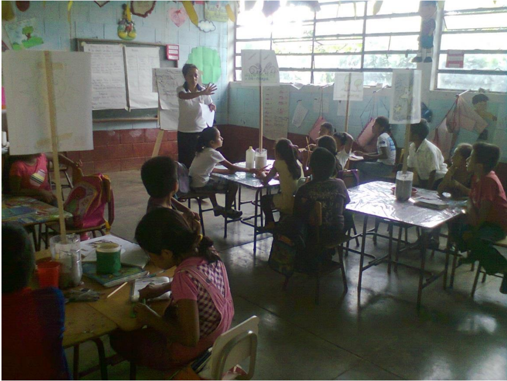
Anexo No. 7. EORM. El Naranjal. Leamos Juntos.