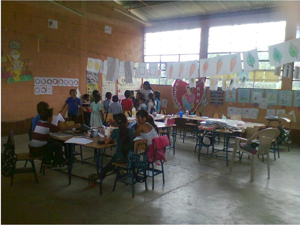
Anexo 3. EORM. Caserío Zelandia. Mi Aula Letrada.