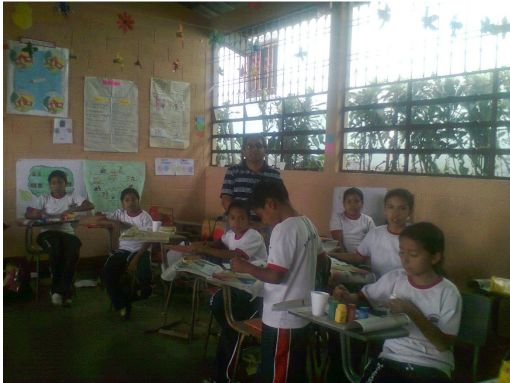
Anexo 9. EORM Santo Domingo. Comprensión de lectura.