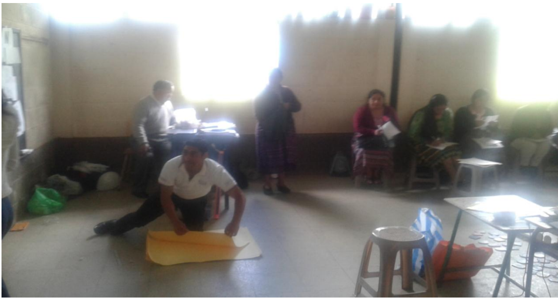
Orientación a directores y docentes de los establecimientos. Fotografía No. 5