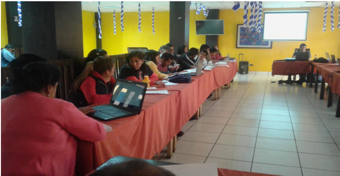
Formación de Equipo de trabajo. Fotografía No. 3