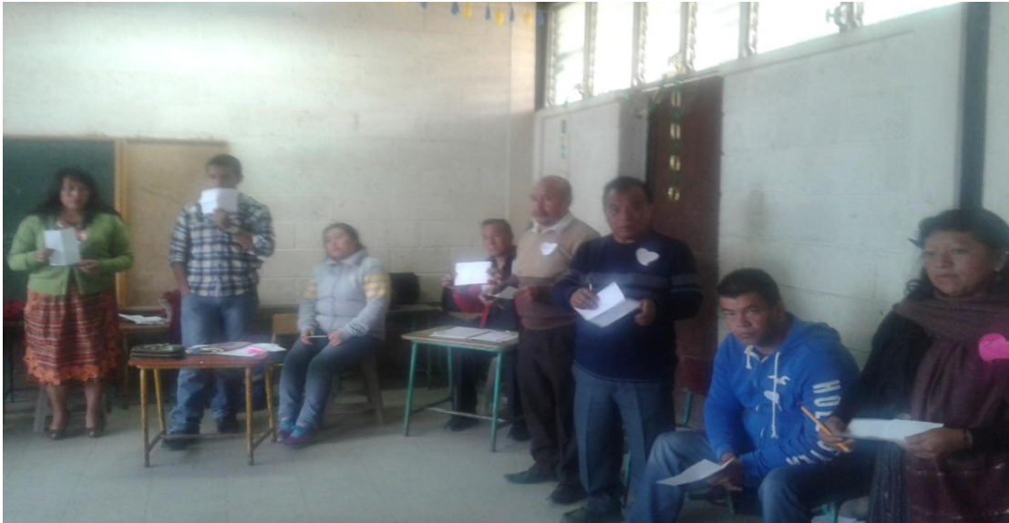
Utilización de técnicas y estrategias para desarrollar la habilidad lectora. Fotografía No. 6