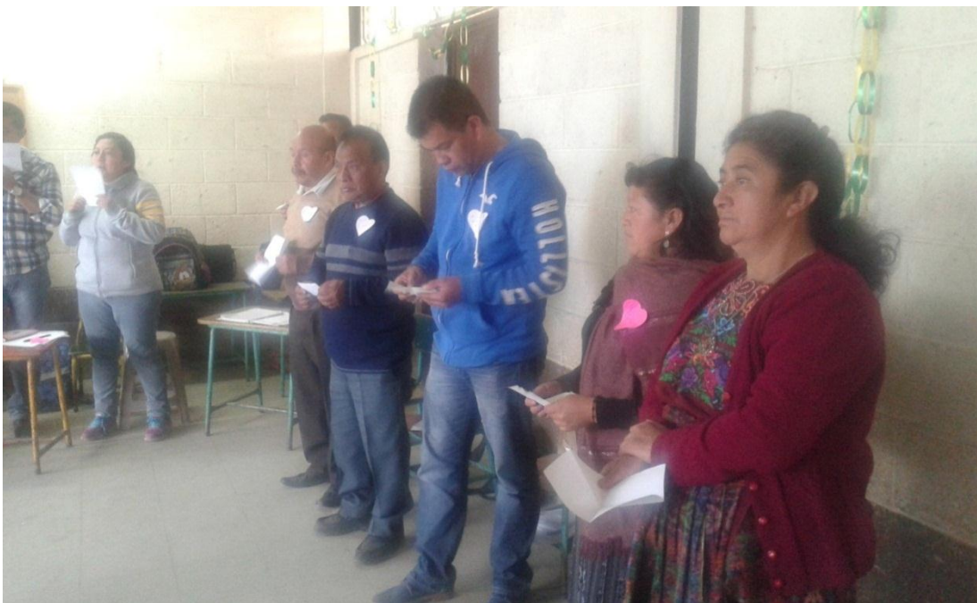
Socialización de avances para tratar el problema de la dislexia. Fotografía No. 7