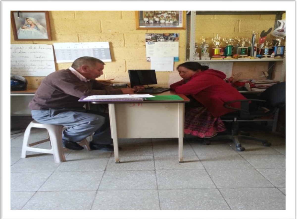
E.O.R.M. Manuel García Elgueta, Cantón Chotacaj, Tonicapán.

Confirmación del problema de la dislexia: Se confirma el problema de la dislexia con otros estudiantes del mismo grado.