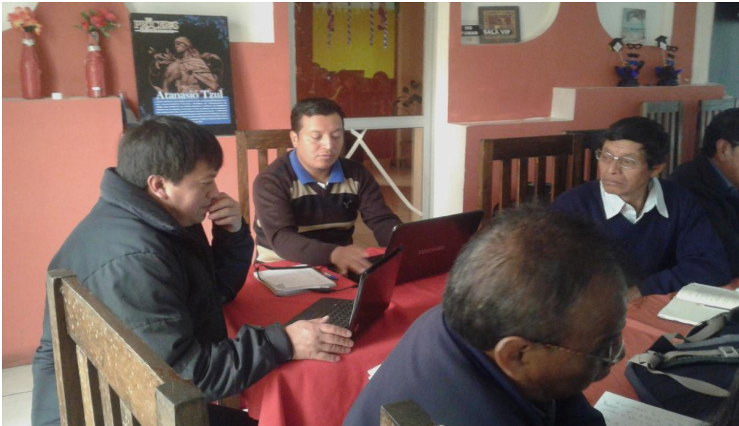
Socialización del plan del problema de la dislexia con directores y docentes Fotografía No. 1