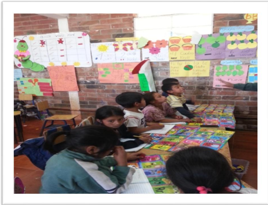
E.O.R.M. Paraje Chiucá, Zona 4, Totonicapán.

Durante el proceso de observación y acompañamiento didáctico, se ha visualizado en los cinco centros educativos del nivel primario la deficiencia de los niños y niñas en la comprensión lectora, ya que la mayoría de ellos no logran reconocer letras o códigos y asociarlos para formar palabras. También no tienen la exactitud al leer repercute en, no captar el significado de una oración o un párrafo. A continuación algunas evidencias de diagnóstico del problema en las escuelas del nivel primario con los niños y niñas de primer grado.