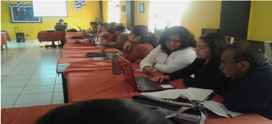
Reuniones con directores Fotografía No. 2