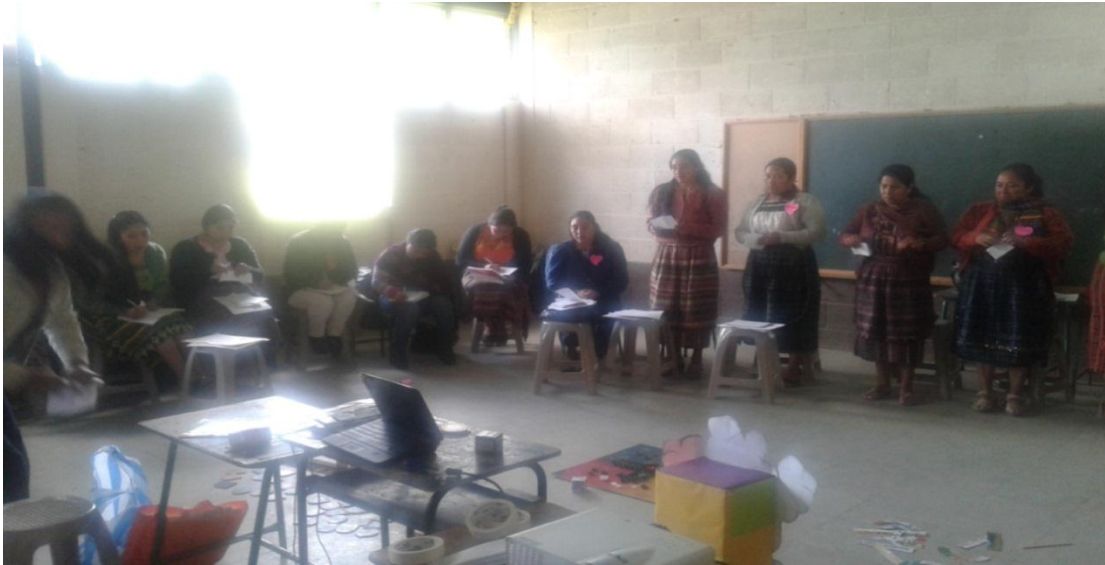
Reunión de los cinco establecimientos con directores y docentes. Fotografía No. 4