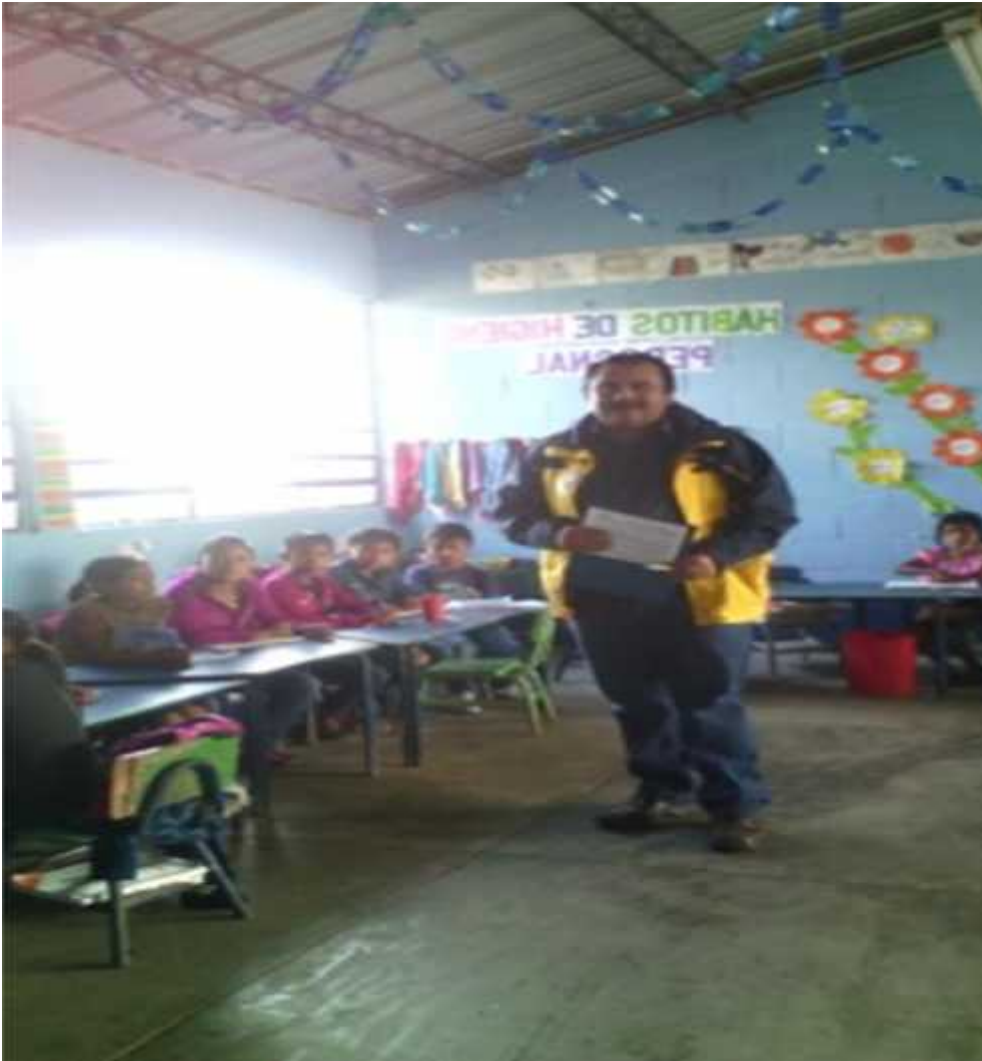
Fuente: Maestrante aplicando evaluación de seguimiento a alumnos y alumnas del Instituto de NUFED, del caserío Las Lomas