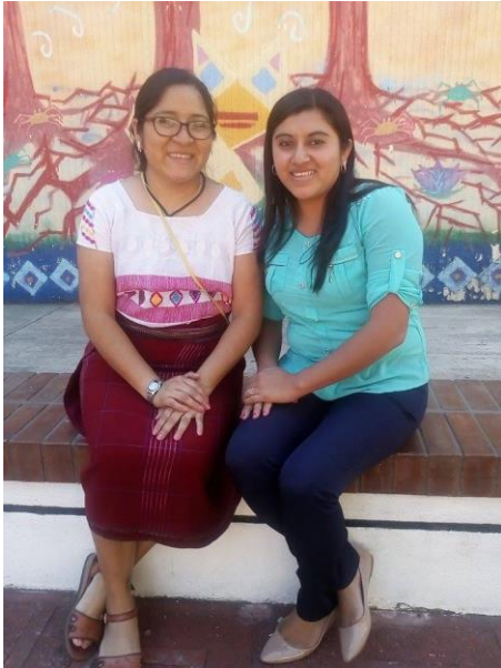
Entrevista con la escritora Norma Chamalé