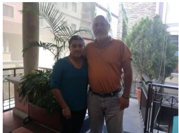
Entrevista con el escritor Javier Mosquera