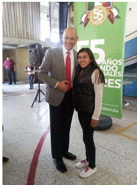
Entrevista con el conferencista y escritor Andry Carías