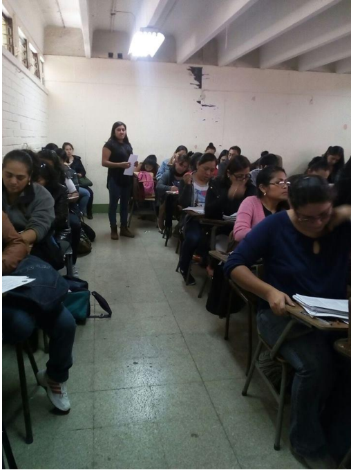
Encuesta con estudiantes del primer año de la licenciatura en la enseñanza del Idioma Español y la Literatura