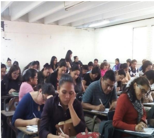
Encuesta con estudiantes del primer año de la licenciatura en la enseñanza del Idioma Español y la Literatura