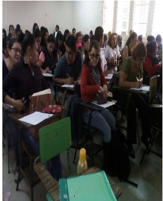
Encuesta con estudiantes del primer año de la licenciatura en la enseñanza del Idioma Español y la Literatura