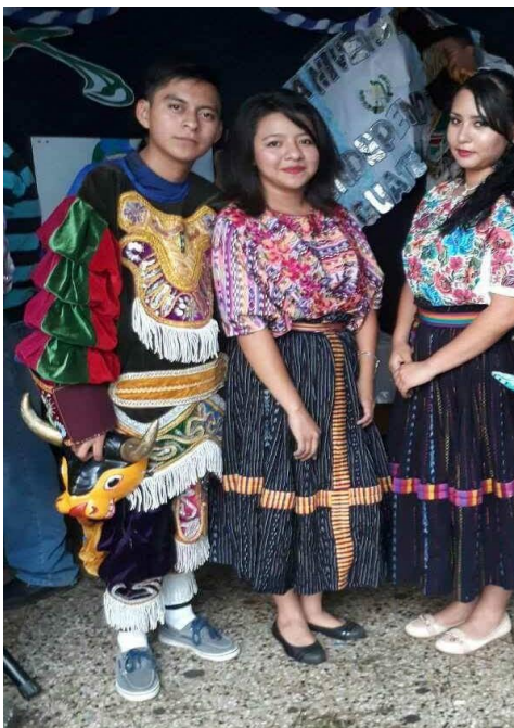
Tarde cultural con alumnos del INEB "La Brigada"