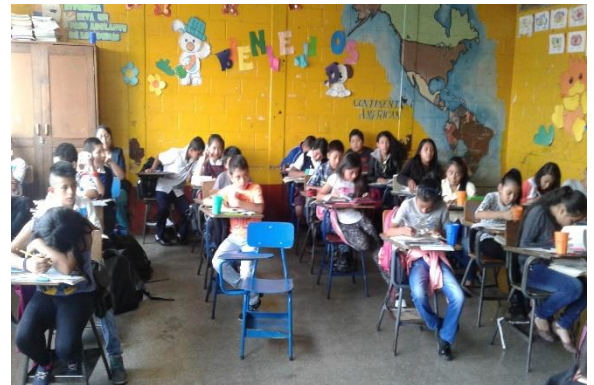
Alumnos de cuarto Primaria, recibiendo clases