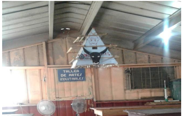
Taller de Industriales INEB CAROLINGIA