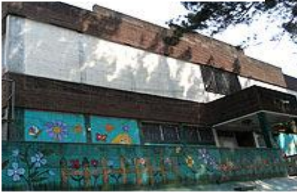
Entrada de Escuela Franklin D. Roosevelt